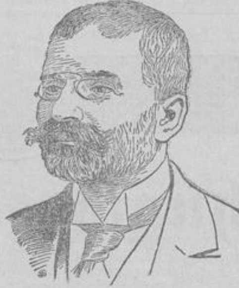
Dr. v. Spinnmüller, der neue österreichische Ministerpräsident.

Reuter meldet aus London: Der Nachtragsetat zur Verstärkung der Armee um eine Million Mannschaften für das Rechnungsjahr, das am 31. März 1916/17 endet, ist jetzt eingebracht worden. Die Mannschafsziffer bedeutet, so fügt Reuter hinzu, vermutlich eine Verstärkung über die schon für 1916/17 bewilligte Mannschafszahl hinaus. Die ursprüngliche Schätzung von 4 Millionen Mann würde sich jetzt auf 5 Millionen stellen.