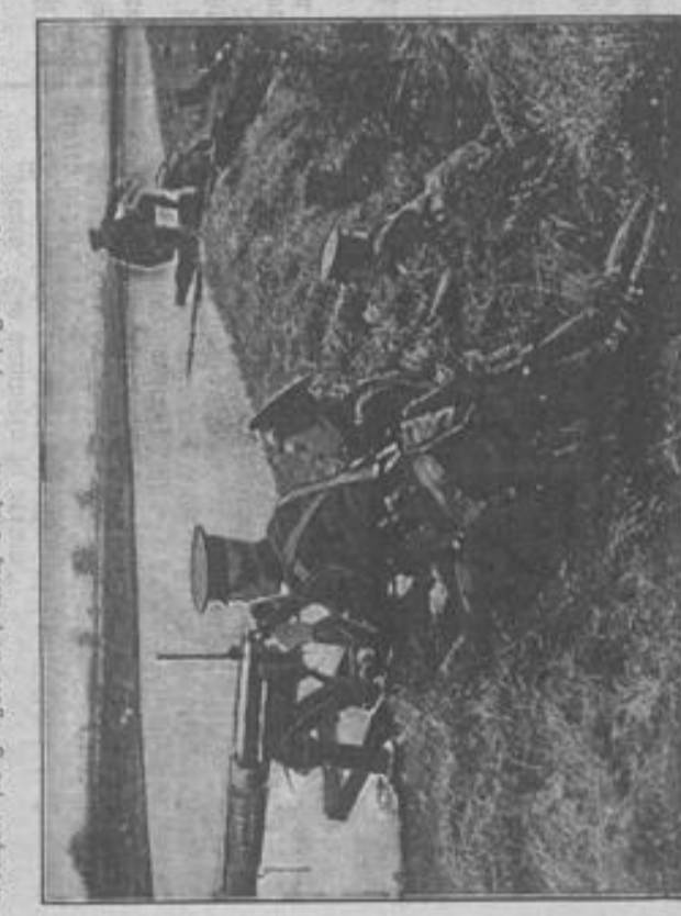
Englische Maschinengewehre am Westkanal. Das Gebiet an der Westküste, das von britischen Kanonen durchzogen und zum Teil von den Engländern durch Ueberflurungen unzugänglich gemacht ist, kann dadurch von den feindlichen Kräften vorläufig noch ganz gut verteidigt werden. Die Deutschen werden schon wissen, auf welchem Wege sie auch diese Verteidigungsmaßregeln überwinden können. Wir sehen auf unserem Bild eine englische Maschinengewehr-Abteilung an den Ufern eines der Kanäle an der Westküste eingegraben.

„Was ist nicht wahr, Vater!“ Hans Willibald war aufgesprungen und sah den Vater fornesvoll an. Vor seinen Augen sprühten feurige Funken und in reichlich gerolfene Mäkel hielt Hans Willibald bereits in seinem Hohn. „Was? Bist Du nicht ganz gesund, Zunge?“ rief der Vater. Herr Bracht starrte seinen Jüngling erstaunt an und auch Frau Bracht war blaß geworden. „Sie sah mit einem Male klar: der Grieche war also an ihren Sohn Hans Willibald gerichtet gewesen! Sie fühlte quers einen Stich im Herzen, daß ihr Jüngling ihr so etwas antun konnte. In gleicher Zeit kam es aber auch wie eine Erleuchtung über sie: ihr Liebling, Hans Willibald, war also nicht dieser Gans verfallene Nörner gewesen, woran sie doch die schärfste Hoffnung gesetzt hatte. Sie sah nun doch wohl jeder Mann aufzukommen.“