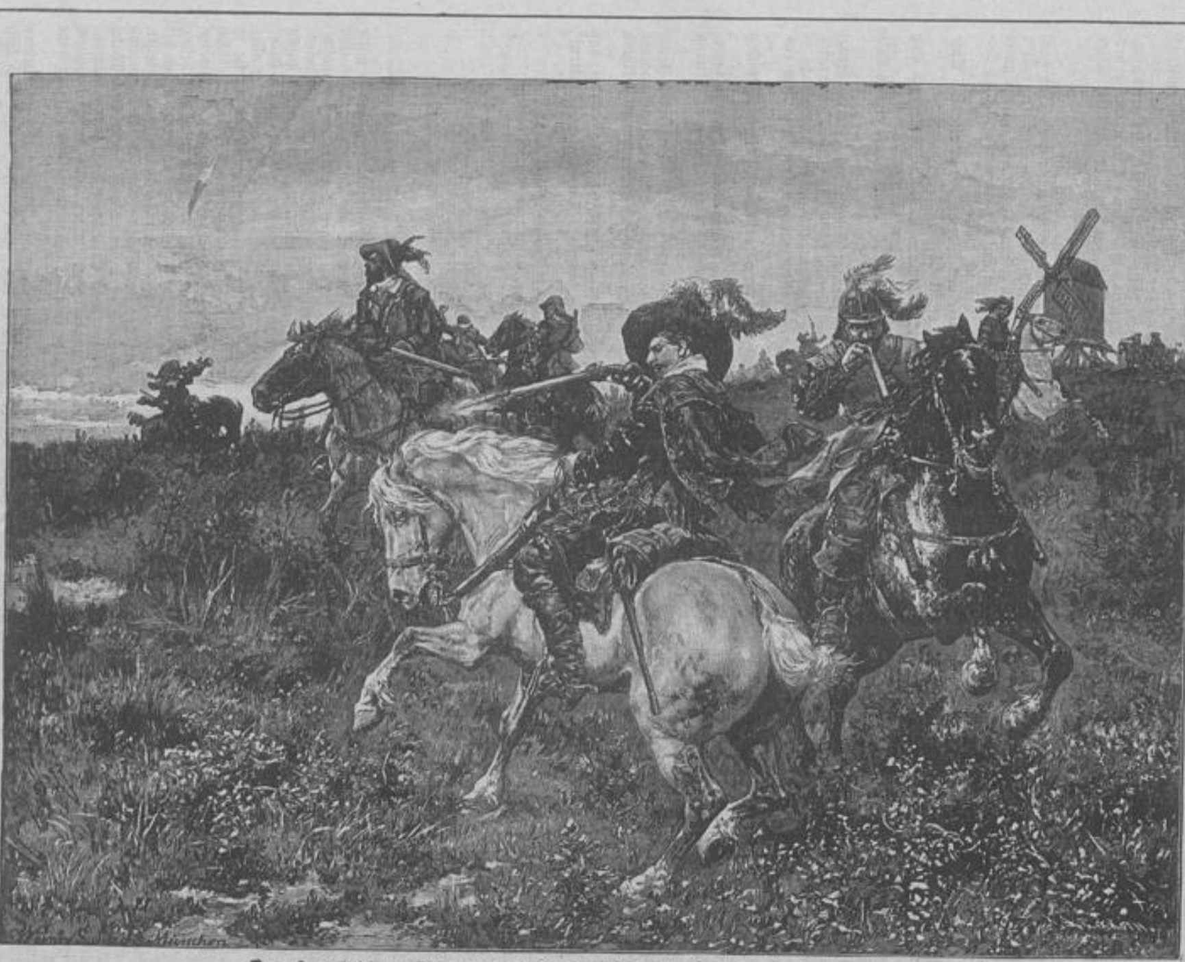
Dorpengefecht zur Zeit des dreißigjährigen Krieges. Nach dem Gemälde von W. Schuch.