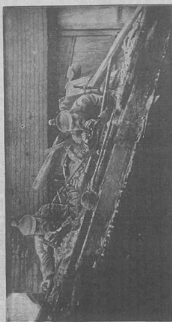
Eine Patronille auf einem zerfallenen Dach. Alle nur irgend sich bietenden Gelegenheiten werden benutzt, Beobachtungspunkte gegen den Feind zu erhalten und geschlossene Häuser bieten sich vornehmlich an. Untere Reihen sind besetzt, wie wir aus dem Bild sehen, diese Gelegenheiten sorgfältig auszunutzen.

„Berger, Silbe, aber ich bin manchmal ein bißchen spröde los, weil ich einen Fehler an der Zunge habe.“ „Sist sie nicht lang genug, oder fehlt es an der nötigen Spitze? Ich kann mit beiden ausbilden.“ Dabei streckte Silbe ihrem Vetter verflochten die rosige Zunge heraus.