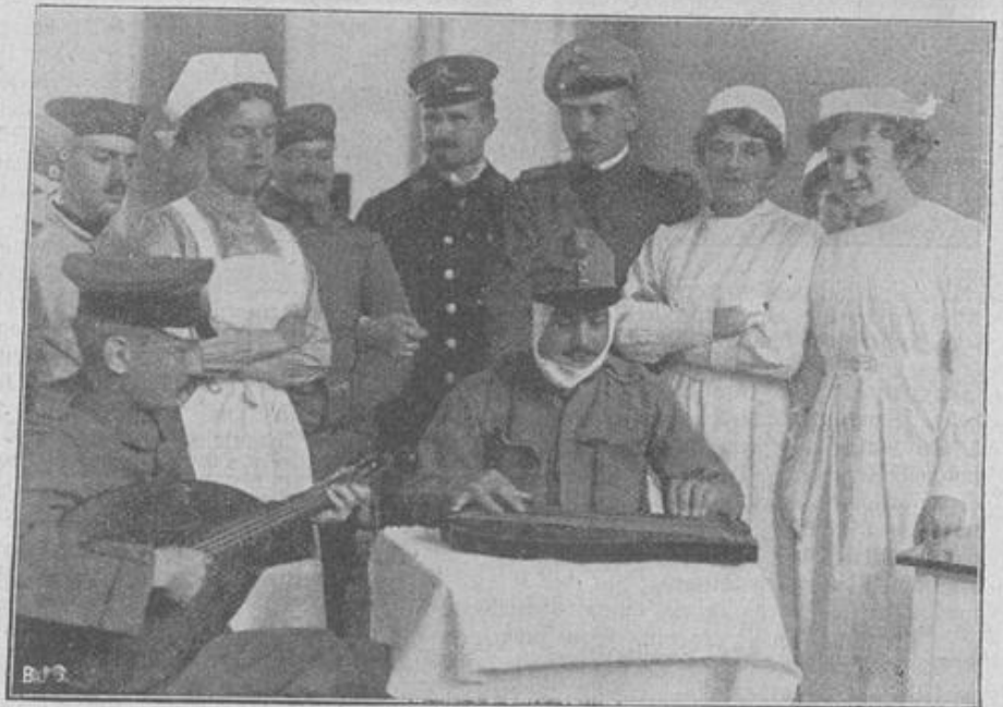
Während der Genesung.

ridam begrüßt. Sodann begab sich Dr. Vertram, der bisher als Bischof in Hildesheim tätig war, nach dem Kultusministerium, um hier vor dem vom Kaiser beauftragten Kultusminister den Homagialeid zu leisten. — Zum Kampfe an der Nordseeküste. Das Abfeuern einer schweren Haubitze aus gedeckter Stellung gegen die das Feuer erwidern den englisch-französischen Kriegsschiffe. — Während der Genesung. Die beiden Verbündeten, der Oesterreicher und der Deutsche, finden für ihr Konzert im Lazarett eine andächtige Zuhörerschaft. Marine, Infanterie ohne Chargenunterschied, alle lauschen sie dem Spiel der beiden.