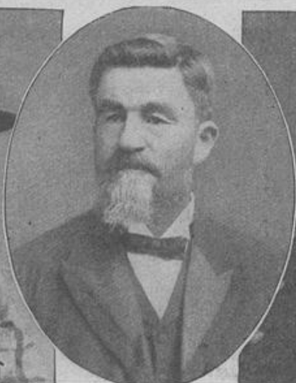
Christian De Wet.