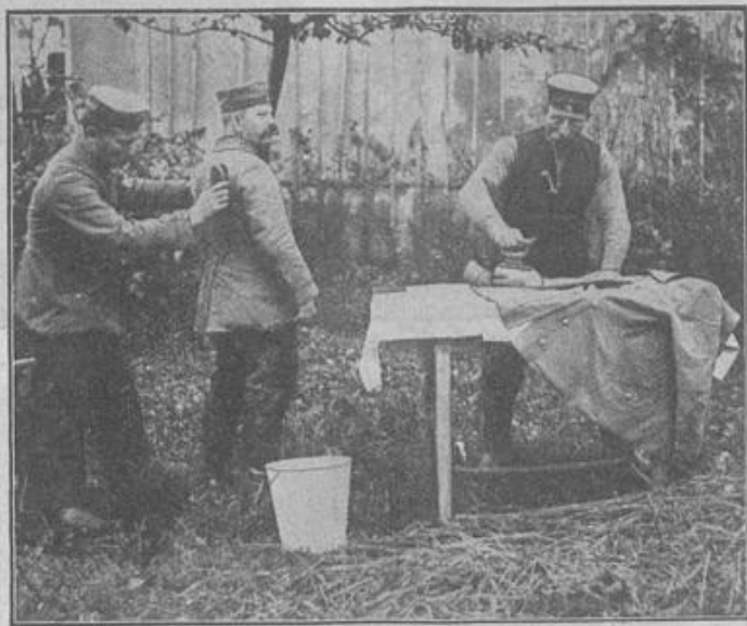
Vor dem Appell.