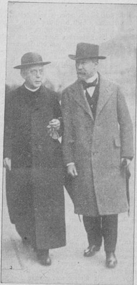
Der Fürstbischof von Breslau Dr. Vertram (x) in Berlin.