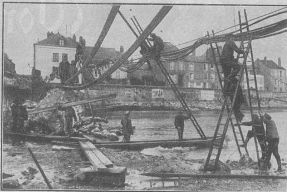
Eine Feldtelegraphen-Abteilung beim Legen von Kabeln.

der Wiedergenesene. Langsam und ein wenig schwerfällig zwar noch, aber doch mit einem fröhlichen und glücklichen Lächeln auf dem noch von durchkämpften Leiden zeugenden Mund, schreitet er auf das regungslos, die rote Nase noch in zitternder Hand haltend, verharrende Weib zu. „Anita,“ leise und verhalten klingt es durch das Zimmer. „Anita,“ nicht abgerissen und schmerzlich, wie sie es