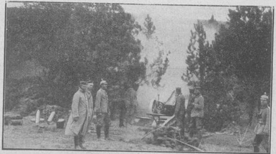
Zum Kampfe an der Nordseeküste.