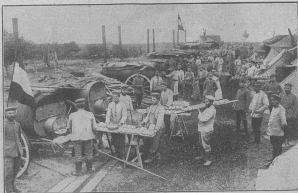
Eine Feldbäckerei in Feindesland.

Geduldig horrten die nicht mehr Zugelassenen in dem Vorgarten des Universitätsgebäudes. Zwei Stunden vergingen. Da hörte man von oben ein Stimmengewirr, die hohen Flügeltüren zur Aula wurden geöffnet, und die Glücklichen, welche noch ein Plätzchen auf der großen steinernen Freitreppe in der Halle erwischt hatten, sahen Proellius umringt von einer Schar berühmter Kapazitäten der medizinischen Fakultät auf dem Podium dem Minister gegenüber stehen, welcher dem Professor als Zeichen der landesherrlichen Anerkennung einen Orden erreichte. Hinter dem Gezeierten stand der Student Ahrendsen, und vielen Kommissionen, welche ihn näher kannten, erschien er fast fremd geworden. (Schluß folgt.)