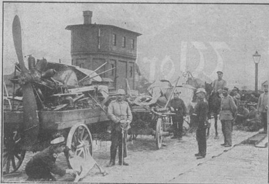
Erbeutete russische Flugzeuge.

Bei den letzten Kämpfen an der russischen Grenze gelang es der Armee des Generalobersten v. Hindenburg auch den russischen Flugzeugpark zu erobern. Die Maschinen wurden auseinander genommen und als willkommene Siegesbeute nach Deutschland befördert.