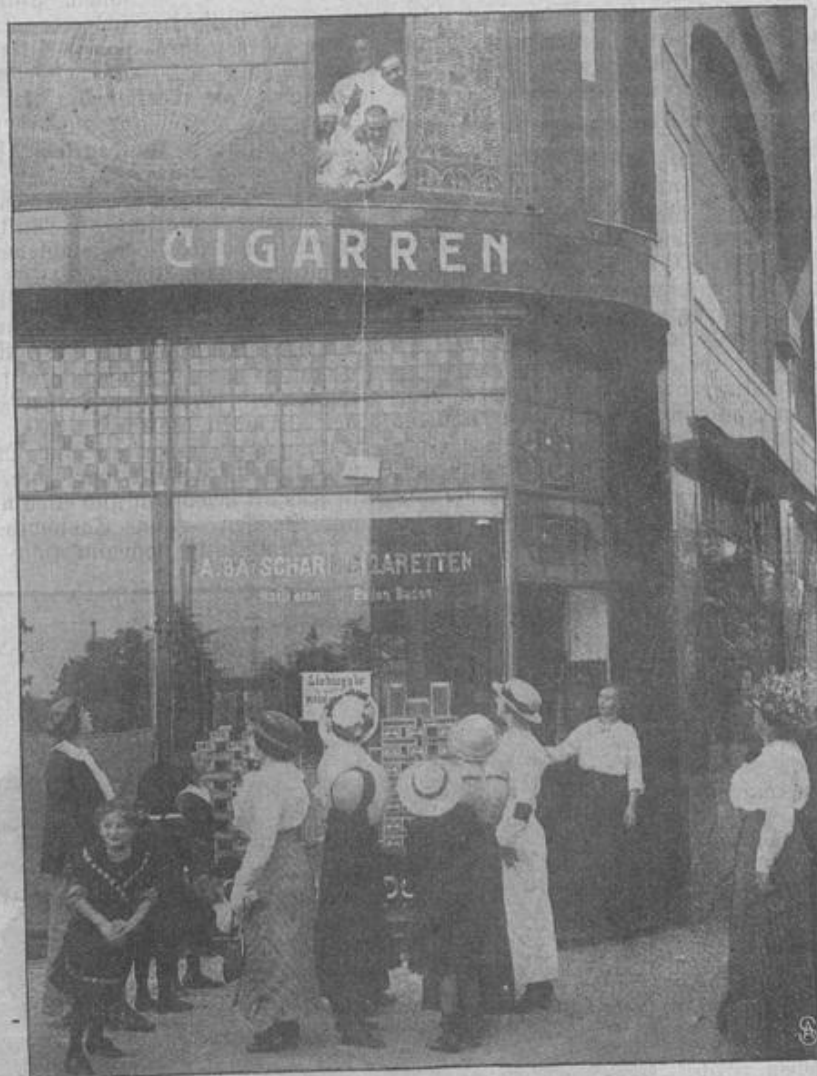
Die „Windfadenpost“ in Schöneberg.

Sie gab dem Ausdruck, und der alte Baron sagte mit einem kurzen, knurrenden Lachen: „Kein Wunder. Maltes Großvater war mein Bruder und seine Großmutter war meine leibliche Kusine. Auch eine Annemarie Malchwig. Du bist ihr übrigens wie aus dem