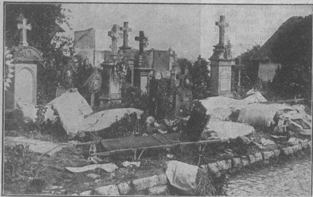
Der Lauterfinger Friedhof in Lothringen um den von deutschen und französischen Truppen schwer gekämpft wurde.

Annemarie war seinem Blicke gefolgt. Nun wies sie mit stolzem Lächeln auf die Schränke: „Noch eine Kostbarkeit, Vetter, ähnlich wie die Bibliothek. Nur, daß ich hierfür Verständnis habe. Ich fand auf dem Boden eine interessante Sammlung Meißener Tassen — sie umfaßte sämtliche Meißener Perioden bis etwa 1820. Es mag unsere Urgroßmutter — hier,“ sie zeigte auf eine Dame an der Wand, die noch im Rokokofleide gemalt war, „die Sammlerin gewesen sein. Sie ist sehr alt geworden und etwa um 1820 gestorben. Sie stammte aus Sachsen — eine Carlowitz — und hat wohl den Stamm der Sammlung noch am Hofe Augusts des Starken angelegt.“