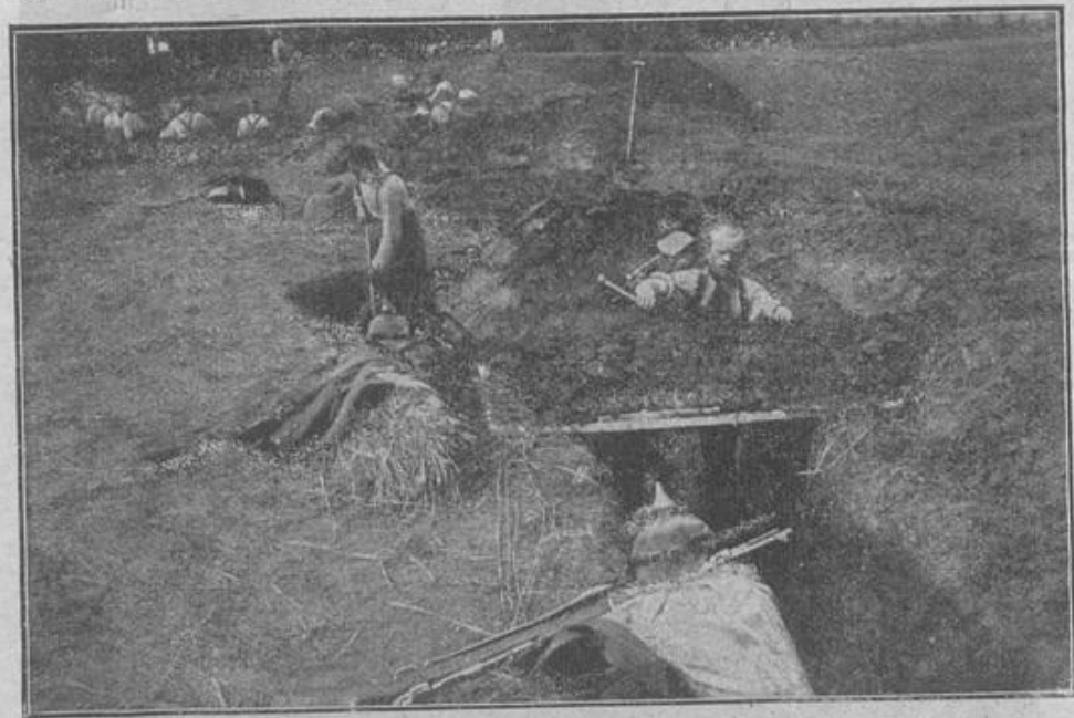
Beim Auswerfen von Schützengräben in der Verteidigungsfront