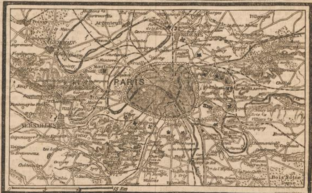
Karte von Paris und Umgebung.

Zu dem Sieg des österreichischen linken Flügels in Galizien schreibt das „V. T.“: Dadurch, daß der russische rechte Flügel der großen Schlachtlinie durch die Verfolgung der Armeen Douff und Klaffenberg soweit abgedrängt wurde, muß natürlicherweise das russische Zentrum bei Lemberg mit beeinflusst werden. Zwar hören wir, daß dort die österreichisch-ungarischen Truppen eine sehr schwierige Stellung haben. Man darf aber deshalb noch nicht annehmen, daß die österreichische Mitte von den Russen ein-