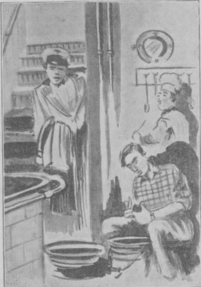
Zeichnung: Schimpe. Ich sah in der Kombüse des „Cormoran“, als der Chefsteward die Treppe herunterkam, eine weiße, goldbetreßte Jacke und eine weiße Hose überm Arm.

Eine Verschwörung „Ist denn an Bord eine Verschwörung beabsichtigt?“ „Eine Verschwörung gegen die heiligsten Belange dieser großen Nation, gegen die Bankkonten der kleinen Leute. Also hören Sie mal zu: Sie wissen ja auch, daß die Börsentrachs sich merkwürdig häufen, daß die Industrie entweder dichtgemacht hat oder leerläuft, um den Schein der Beschäftigung vorzutäuschen und ihre Papiere an der Börse zu halten. Das tut sie nun natürlich nicht aus dem humanen Grund, das Geld ihrer kleinen Aktionäre zu schützen, sondern nur deshalb, um noch einmal die Papiere an der Börse hochzuschlagen und dann die eigenen Aktien loszuschlagen, und „nach uns die Sintflut“ oder die große Pleite, wie der Dichter so schön gesagt hat. Auf der „Cormoran“ soll nun, dafür glauben wir hinreichend Beweise zu haben, ein letzter Schlag