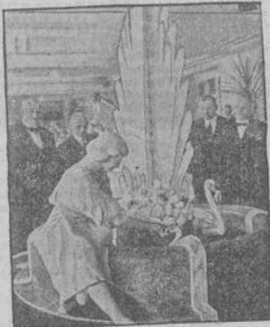
Rondirektoren-Fest in Berlin. Das Mangfäß der Ausstellung: ein aus Marzipan geformtes Brunnen.

Wärme ist Leben! Wir wissen, daß wo Wärme fehlt alles Leben sterben muß. Die Natur zeigt uns recht, daß sich alle Tiere, alle Pflanzen auf den Winter vorbereiten. Auch der Mensch muß an die kommende Winterzeit denken, er kann es ohne Sorgen tun, denn ihm ist das Mittel gegeben, auch während der kalten Zeit Wärme, das heißt Leben um