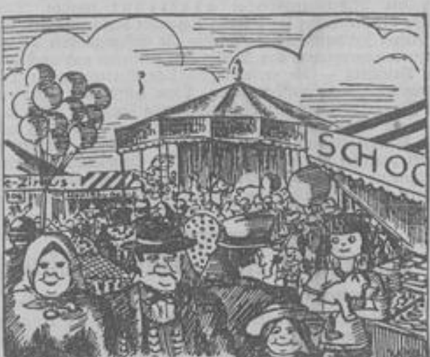
Uff de Kerb iss Alles klar...

Ja, ja, so ist die Flörsheimer Kerb wieder einmal da und man kann ruhig sagen, im Zeichen größerer Schwulstigkeiten ist sie, vom großen Krieg abgesehen, Zeit unferes Lebens noch nicht begangen worden. Auch rein äußerlich dokumentiert sich das schon! — Vor 8 Tagen war ein Erdbeben, das auch in Flörsheim die Bettladen und Küchenschränke wackeln ließ und zuletzt war vor 8 Tagen der Main so gestiegen, daß die „Aräm“, die seit einem Menschenalter stets auf dem Platz am Main aufgebaut war, diesesmal nur mit Ach und Krach, mit Angst und Bangen an der gewohnten Stelle errichtet werden konnte. Man hatte schon ernstlich erwogen, den frü-