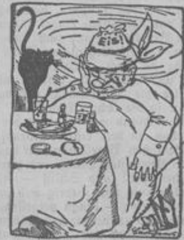
„Der Wahn ist kurz, die Rau ist lang“

Muß aber auch unglückseligerweise die Flörsheimer Genossenschaftsbank in diesem Jahre des Mißvergnügens pleite gehen und so den allgemeinen Wirtwart, den allgemeinen Dalles noch vermehren. Wie soll da der Mensch den rechten Mut und die rechte Lust zum Kerwefeiern finden? Es bleibt nichts übrig, als gute Wiene zum bösen Spiel zu machen und sich mit den Verhältnissen abzufinden.