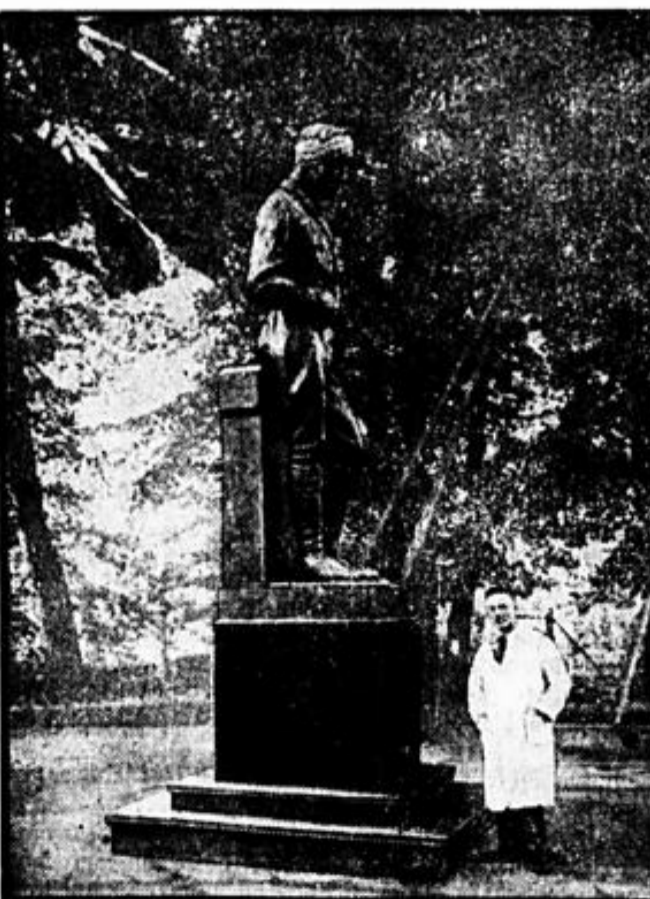
„Der unbekannte verwundete SA-Mann“

Vare, 9. Okt. Bei dem Automobilrennen um den Pokal der Prinzessin von Piemont ereignete sich ein schweres Unglück. Bei der Durchfahrt der an dem Rennen beteiligten Autos durch die Gemeinde Giovinazzo warf das von dem Deutschen Groß gesteuerte Auto mehrere Zuschauer zu Boden. Vier Personen wurden getötet und zwei schwer verletzt.