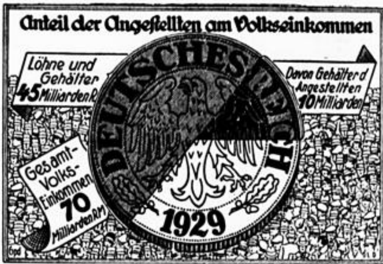
Aus der großen sozialen Erhebung des GDA.

Die Erhaltung der Kaufkraft des Angestelltenstandes ist in dem wachsenden Industrie- und Handelsstaat eine Lebensfrage der deutschen Wirtschaft!