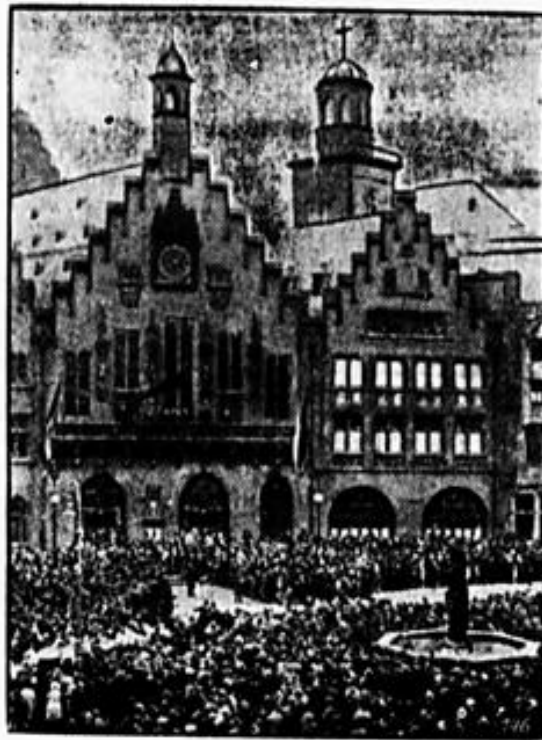
Der evangelische Volkstag in Frankfurt a. M.

Das Institut für Konjunkturforschung schätzt das deutsche Volksinkommen im Jahre 1929 auf 69 bis 72, das Einkommen aus Lohn und Gehalt auf 44,5 bis 45,5 Milliarden Reichsmark. Hiervon entfallen nach den durch die GDA Erhebung gewonnenen Unterlagen rund 10 Milliarden Reichsmark, d. h. nahezu ein Viertel des Einkommens aus Lohn und Gehalt oder ein Siebtel des ganzen Volksinkommens, auf die Gehälter der Angestellten.