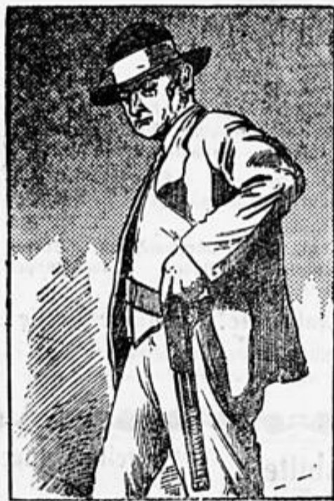
Im Kampf gegen das Verbrechertum.

* # Weitervorhersage für Sonntag und Montag. Im Flachland bewölkt, vielfach neblig und Niederschläge bei leichter Abkühlung. Im Gebirge heiter.