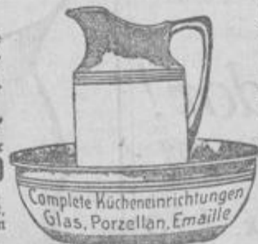
Complete Kücheneinrichtungen Glas, Porzellan, Emaille

Paneele, viele Sorten, von 45 Mk. an Saucerische, viele Sorten, von 125 Mk. an Papierkörbe . . . . . von 50 Mk. an Waschbänder . . . . . von 60 Mk. an Putzkasten . . . . . von 30 Mk. an Gierkörbe . . . . . von 35 Mk. an Briefkästen . . . . . von 30 Mk. an Edelrotter . . . . . von 30 Mk. an Küchen-Etagere . . . . . von 85 Mk. an Leitern . . . . . Stufe von 45 Mk. an