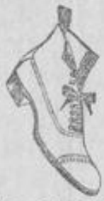
Knaben-Schuhkiesel, moderne Form, solide durchaus. 5.50, 6.50, 7.50.