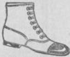
Sohlelegante Stiefel mit Lacklappen, echt Chevreau, Größen 27-30 für 5.50, Größen 31-35 für 6.75.