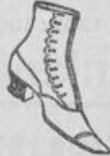
Knopfschuh, wunderbare Formen, 7.50.