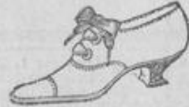
Schnürschuhe, braun und schwarz, enorm preiswert.