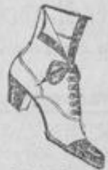
Feine echt Mokass-Stiefel, elegante Formen, von 7.50 an.