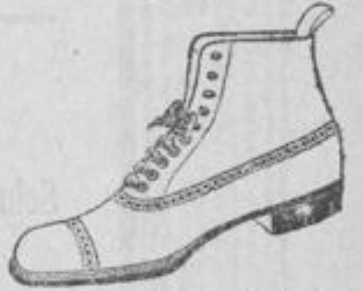
Herren-Feine Stiefel moderne Formen unter Garantie für jedes Paar. Chromleder mit Lacklapp. . . 7.50 Wachleder, sehr hart . . . von 6.50 an Vollkaltleder . . . von 8.50 an System Handarbeit Chevreau od. Vellleder . . . 11.50.