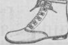
Mokass oder Chevreau, braun u. schwarz, 1.250 u. 3.—