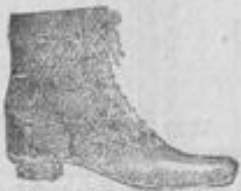
Wischleder-Schuhkiesel, Größen 25-28 für 2.00, Größen 27-30 für 3.25 u. 3.00, Größen 31-35 für 3.75 u. 3.50, zum Knöpfen oder Schnüren.