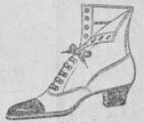
Damen-echt Chevreau- Stiefel mit Lacklappen von 6.75 an, in Chromleder von 5.90 an.