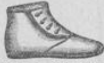
Leder mit Fellefutter von 1.95 an.

Wiesbadener Schuhwaren-Konsum-Gesellschaft zwischen Luisenstraße u. Friedrichstraße. Telefon Nr. 3010. 19 Kirchgasse 19, nahe der Luisenstraße. Bitte Nr. 19 zu beachten! Telephon Nr. 3010.