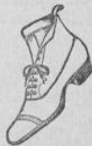
Feinstes Vorkalf, Feinstes Chevreau, schwarz und braun.

Die Wiesbadener Schuhwaren-Konsum-Gesellschaft unterhält hier in Wiesbaden keine Filiale, weshalb auf die Adresse Kirchgasse 19, zwischen Luifen- und Friedrichstraße, besonders aufmerksam gemacht wird. Jeder Kunde erhält bei uns auf Wunsch, auch bei kleinsten Einkäufen einen Gutschein, der sofort eingelöst werden kann.