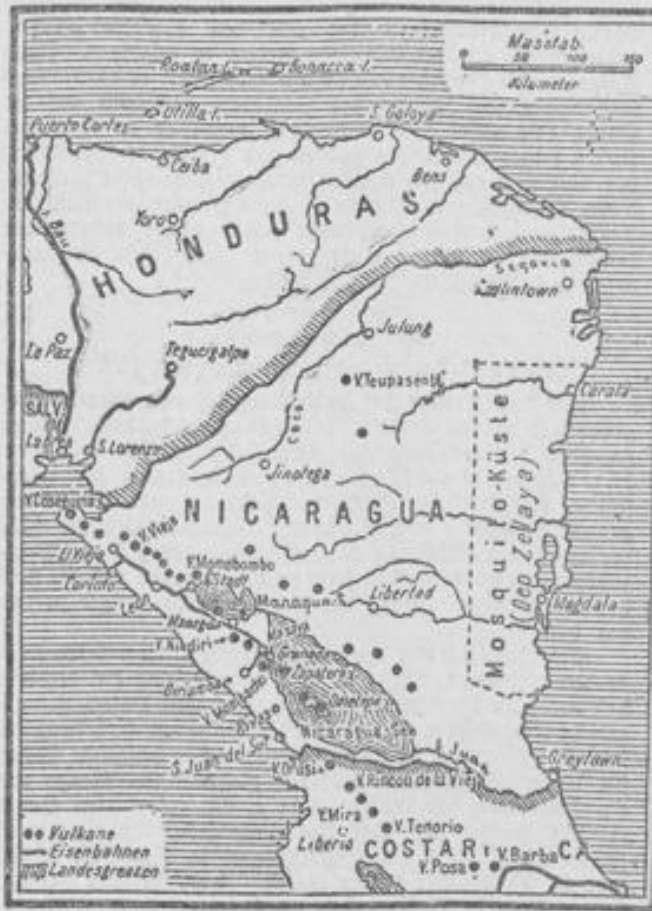
Das Vorgehen der Union gegen Nicaragua.

Nach New Yorker Meldungen aus Nicaragua sind die nicaraguanischen Insurgenten bereits Herren der halben Republik, einschließlich der Ostküste, an welcher die wichtigste Hafenstadt Nicaraguas, Greytown, liegt.