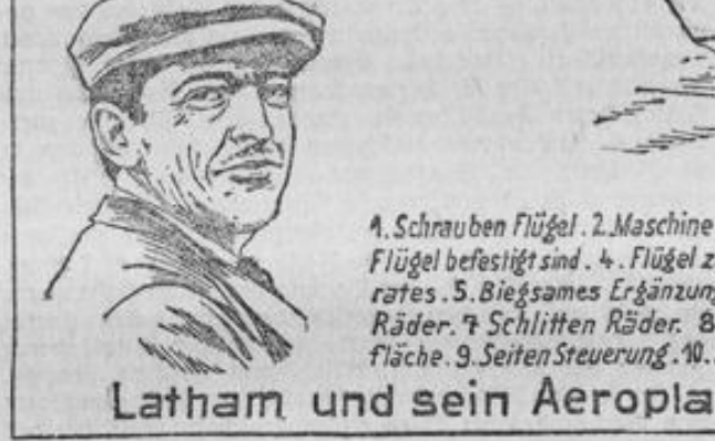
Latham und sein Aeroplan.

Luftschiffe und Aeroplane. Nach langem Zögern hat Latham endlich den Flug über den Kanal mit seinem Aeroplan gewagt. Wie vorausgesehen war, ist er mit dem Apparat ins Wasser gestürzt. Unser Bild stellt seinen Apparat dar, der im Äußeren einer großen Möbe gleicht. Der Flug selbst begann 500 Meter vor dem Meeresufer. Der Apparat nahm auf den unten erkennbaren Rädern einen Anlauf und erhob sich nach 80 Meter in die Luft. In mehreren Windungen schlang er sich zu einer Höhe von 200 Meter empor und schlug dann den Weg nach Dover ein. Zweifellos würde er dort angekommen sein, wenn nicht...; dieses „Wenn nicht“ ist bisher bei allen Versuchen mit Flugmaschinen eingetreten, es hat Menschen das Leben gekostet oder doch sie schon schwer verletzt und hat Hunderte von Maschinen zertrümmert. Und dieses „Wenn nicht“ wird sich auch noch auf lange Zeit hinaus einer praktischen Verwendung der Flugmaschinen hindernd in den Weg stellen. Wenn Latham trotzdem den Mut nicht verloren hat, und den Versuch demnächst erneuern will, so mag er es tun. Er soll aber dann vorher nicht die Reklametrommel rühren, wenn er sich ein neues Fiasko ersparen will.