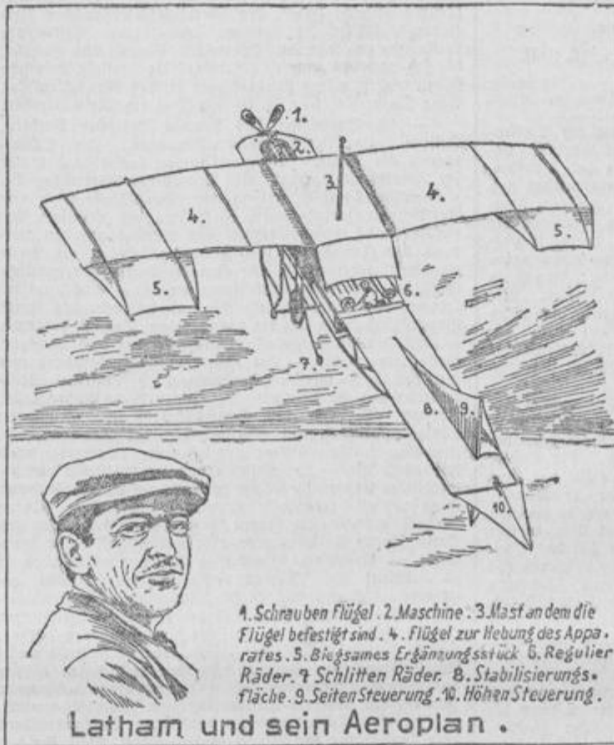
1. Schrauben Flügel. 2. Maschine. 3. Mast an dem die Flügel befestigt sind. 4. Flügel zur Hebung des Apparates. 5. Bißsames Ergänzungstück. 6. Regulier Räder. 7. Schlitten Räder. 8. Stabilisierungsfläche. 9. Seitensteuerung. 10. Höhensteuerung.

Nach langem Zögern hat Latham endlich den Flug über den Kanal mit seinem Aeroplan gemagt. Wie vorausgesehen war, ist er mit dem Apparat ins Wasser gestürzt. Unser Bild stellt seinen Apparat dar, der im Äußeren einer großen Möbe gleicht. Der Flug selbst begann 500 Meter vor dem Meeresufer. Der Apparat nahm auf den unten erkennbaren Rädern einen Anlauf und erhob sich nach 80 Meter in die Luft. In mehreren Windungen schwang er sich zu einer Höhe von 200 Meter empor und schlug dann den Weg nach Dover ein. Zweifellos würde er dort angekommen sein, wenn nicht... dieses „Wenn nicht“ ist bisher bei allen Versuchen mit Flugmaschinen eingetreten, es hat meistens das Leben gekostet oder doch sie schon schwer verletzt und hat Hunderte von Maschinen zertrümmert. Und dieses „Wenn nicht“ wird sich auch noch auf lange Zeit hinaus einer praktischen Verwendung der Flugmaschinen hindernd in den Weg stellen. Wenn Latham trotzdem den Mut nicht verloren hat, und den Versuch demnächst erneuern will, so mag er es tun. Er soll aber dann vorher nicht die Reflametrommel rühren, wenn er sich ein neues Flasko ersparen will.