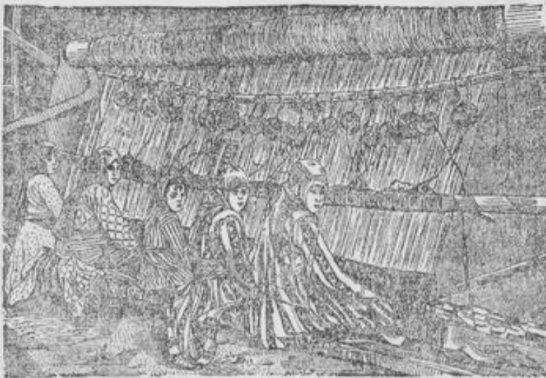
Teppichstuhl der Handknüpferei in Persien des Vertreters der Firma B. Ganz & Cie.

Freidenker-Verein. E. V. Montag, d. 9. Nov., abends 8 1/2 Uhr, im Part.-Saal der Wart- burg: Diskussion üb. Prof. A. Forel's „Die Rolle der Heuchelei, der Beschränktheit und der Unwissenheit in der landläufigen Moral.“ Eintritt frei. Gäste willkommen. F 321