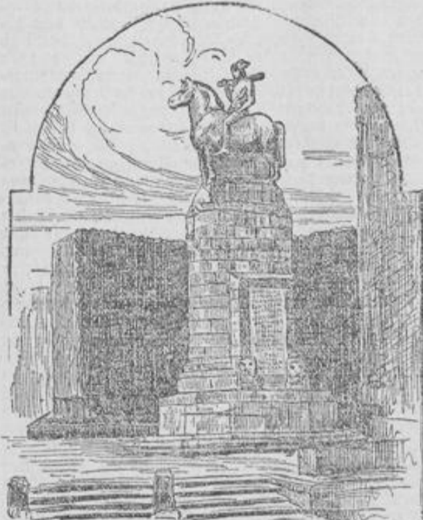
SKIZZE DES NEUEN WIESBADENER KRIEGERDENKMALS.

Demnächst wird am Eingang des Nerothals an dem Platze, wo das alte Denkmal jahrzehntelang gestanden hat, das neue vielumrittene Kriegerdenkmal enthüllt werden, das wir heute schon im Bilde vorführen. Das gehaltvolle, ernste Werk bildet seiner Anlage und seinem