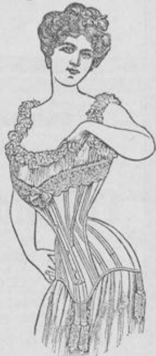
Korsett „Directoire“, Preis G. 25 Mk.

Erste deutsche, Pariser und Brüsseler Fabrikate.