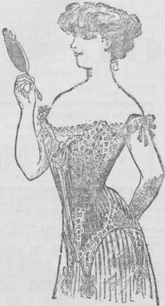
Libelle 8.— Mk.

Modelle aus dem Schaufenster zu jedem annehmbaren Preise. Auswahlsendungen bereitwilligst.