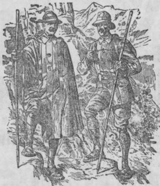
Für jede Figur passende Kleidung.

Marktstrasse 34. Heinrich Wels. Telephon 2491.