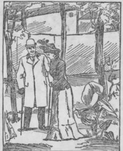
Der Forscher an der Wand hört seine eigene Schand.