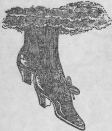
Fernsprecher Nr. 626.

Auf der Jagd verunglückt. Aus Quebec wird gemeldet: Im September v. J. waren zwei Pariser namens Sufat und Deernardt in Begleitung eines Führers nach dem nördlichen Gebiet aufgebrochen, um dort zu jagen; seitdem waren alle drei verschwunden. Nunmehr wurden die Überreste der beiden Franzosen aufgefunden und aus verschiedenen Feststellungen scheint hervorzugehen, daß die beiden infolge von Entbehrungen gestorben sind, nachdem sie vorher ihren Führer verspeißt hatten.