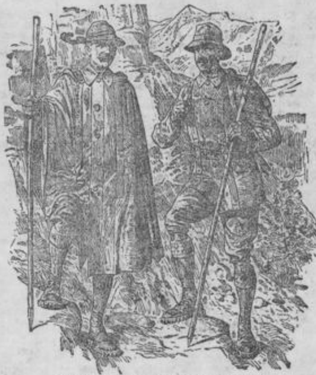
Für jede Figur passende Kleidung.

Marktstrasse 34. Heinrich Wels. Telephon 2491.