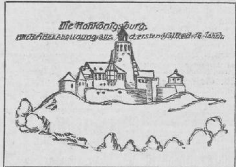
Die Hohkönigsburg, nach einer Abbildung aus der ersten Hälfte des 18. Jahrhunderts

großen und deutlichen Darstellung der Hohkönigsburg. Damit ist das Rätsel, das der vor einiger Zeit aufgefundene Holzschnitt mit der Darstellung eines runden Hauptturmes aufgab, gelöst: der Turm war tatsächlich rund, aber auf quadratischem Sockel. Die Plattform des Turmes trägt die gleiche Laterne wie auf dem Holzschnitt. Weiterhin ist die Bedachung des Hauptgebäudes eine ganz andere als in der jetzigen Rekonstruktion. Kurzum, die Bedenken derer sind vollständig gerechtfertigt, die seinerzeit warnten, bei völligem Mangel einer alten Darstellung in Wort und Bild an die Rekonstruktion zu gehen. Warum hat man damals nicht sorgfältig-