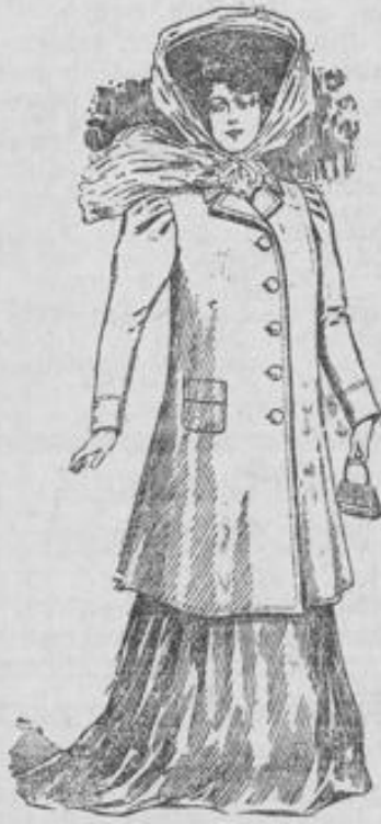
in 12 Farben vorrätig

wie Zeichnung aus Ia imprägniertem Stoff in bester Schneiderarbeit