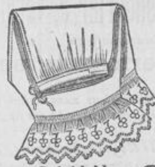
Damen-Beinkleid 2 10 aus kräftigem Hemdentuch, mit Stickerei-Volant, Knie- fasson, 2 Mk.