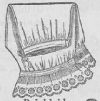
Damen-Beinkleid 2 25 aus kräftigem Hemdentuch, m. reichem Stickerei-Volant, sehr empfehlenswert, 2 Mk.

Kinder-Wäsche in grosser Auswahl bei billigsten Preisen.