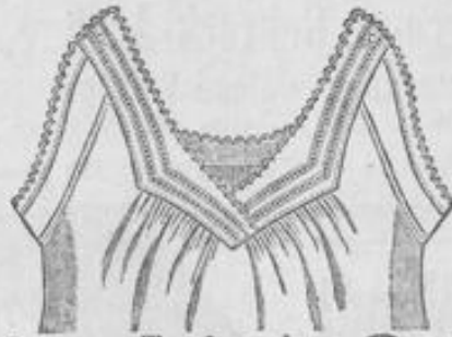
Damen-Taghemd 2 75 In kräftiges Hemdentuch, ausfestoniert, Passe mit à jour-Garnitur, sehr solide, 2 Mk.