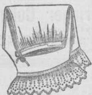
Damen-Beinkleid 1 85 aus feinfädigem Hemden- tuch, Stickerei-Volant, Knie- fasson 1 Mk.