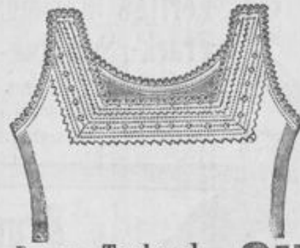
Damen-Taghemd 2 75 aus feinfädigem Madapolam, reich durchbrochen, hübsch. Bändchen-Garn., glatte Form 2 Mk.