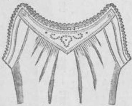
Damen-Taghemd 2 25 aus kräftigem Hemdentuch, mit echter Madeira-Passe und hübschem Festonansatz, völlig weit und lang, 2 Mk.