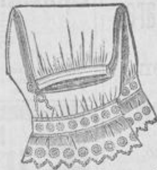
Damen-Beinkleid 1 95 aus mittelfädigem Hemden- tuch, mit hübschem Stickerei- Einsatz und Stickerei-Volant 1 Mk.