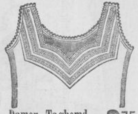
Damen-Taghemd 2 75 aus feinfädigem Hemdentuch mit reicher à jour-Stickerei, hübsche gefällige Form, 2 Mk.