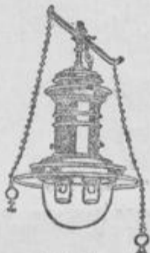
Wind- und regensichere