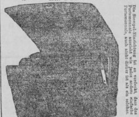
Abbildung in halber natürlicher Größe

Aussergewöhnlich billiges, aber doch gutes und dauerhaftes Stempel-Portemonnaie