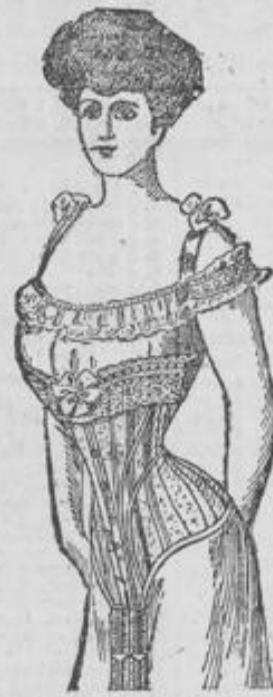
Mireille. Diese Form halte ich zum Inventurpreise von 6, 8, 10, 12 Mk. und eleganter am Lager.

Modelle aus dem Schaufenster und abgeblasste Korsetts = für die Hälfte = des bisherigen Preises.