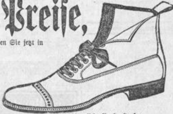
Marktstraße, Ecke Grabenstraße.

Es handelt sich um den Stutzen , worauf besonders aufmerksam gemacht wird. Auch die besten Petersburger Gummischuhe finden Sie nirgends billiger wie in Roth's Schuhwaren-Lager , Marktstraße, Ecke Grabenstraße.