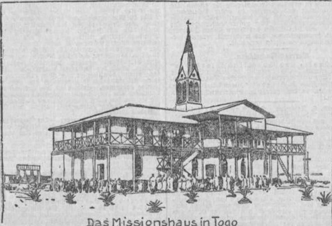
Das Missionshaus in Togo

Unser heutiges Bild bringt unseren Lesern das Missionshaus in Abjida in Togo, das nach der Schilderung des Abg. Noeren der Zielpunkt der Angriffe des Stationsleiters gewesen sein soll. Nach den Mitteilungen des Konsultationsdirektors soll sich die Sache indessen wesentlich anders verhalten haben. Dieser machte nämlich den Patres den Vorwurf, sich in Geschäfte eingelassen zu haben, die nicht ihres Amtes waren. Das wäre ja auch am Ende nichts Neues. So sollten sie gegen ihnen miß-