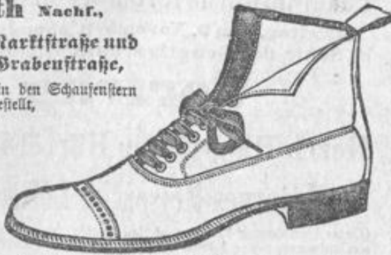
Der schönste Herren-Stiefel, elegant, solid und preiswert.

aus einem großen Gelegenheitskauf zu geradezu fabelhaft billigen Preisen in tadellosen Qualitäten für 7.50, 8.75, 9.75, 10.50, die einen weit höheren Wert repräsentieren.