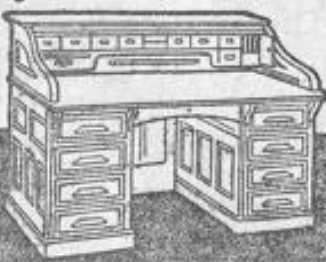
(Baz. 6816) F 125

Glogowski & Co., Frankfurt a. M., Kaiserstr. 47.