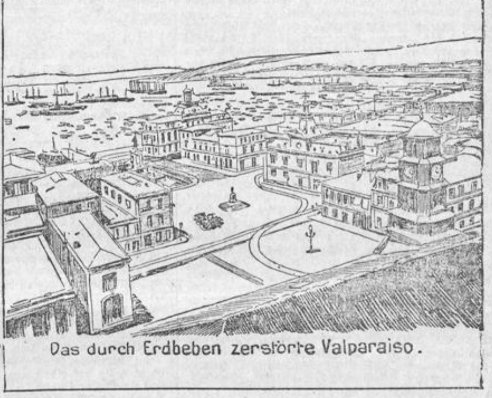
Das durch Erdbeben zerstörte Valparaiso.

* Gödt a. M., 20. August. Die hiesigen Holzarbeiter werden, da die Arbeitgeber ihren neuen Lohnsatz nicht anerkennen und die seitigeren Einigungsverhandlungen zu keinem Ergebnis führten, in den Ausstand treten. Es handelt sich um ca. 500 Arbeiter, die eigens in Möbelfabriken beschäftigt sind.