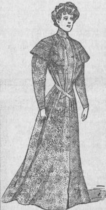
Morgenrock aus waschechem Kattun in neuen Dessins Stück 6.90. Matinee Stück 4.75.

Durch den zentralisierten Einkauf für unsere 11 Kaufhäuser wird unsere Leistungsfähigkeit durch nichts überboten.