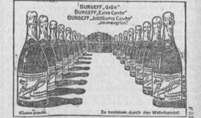
Zu beziehen durch den Weinhandel.

Darmstädter Muebelfabrik. Bedeutendstes Einrichtungshaus Mitteldeutschlands. 300 Zimmereinrichtungen stets lieferr. vorrätig. Man verl. Preis, u. Abbildungen. F 4