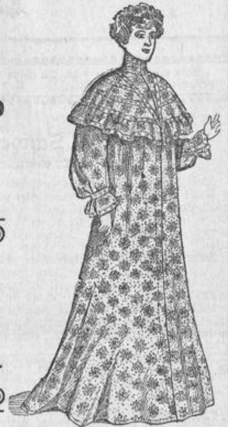
Morgenrock aus imit. Musselin in eleganter Aus- führung Stück 10.90. Matinee Stück 7.90.