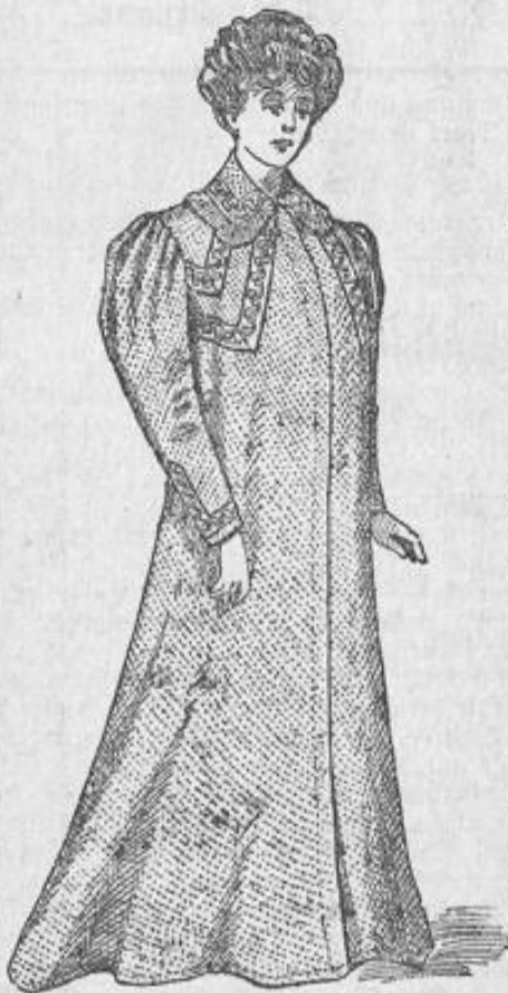
Morgenrock aus solidem Cretonne Stück 4.50. Matinee in derselben Ausführung St. 3.25.