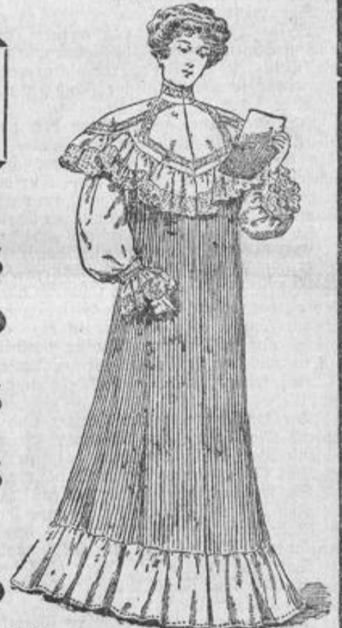
Morgenrock a. reinwoll. Voile u. Batist, plissiert, Stück 18.— Matinee Stück 11.—

Neu eingetroffen! Großer Gelegenheitskauf! Neu eingetroffen 3a. 200 Herren-Anzüge in nur neuesten Mustern, teilweise auf Hochhaare gearbeitet (Gesäß für Maß), deren früherer Ladenpreis war 15, 20-40 Mk., jetzt 10, 15, 20, 25 Mk., ein großer Vollen Herren- und Knaben-Anzüge, deren früherer Preis war 5, 10, 15-25 Mk., jetzt 2.50, 5, 10, 15 Mk., 3a. 100 Herren- und Knaben-Paletots, fürs Frühjahr sehr geeignet, deren früherer Preis war 15, 20-40 Mk., jetzt 5, 10, 15, 20 Mk., ein Vollen Hosen, für jeden Beruf geeignet, früherer Preis 5, 10, 15-18, jetzt 2.75, 5, 8 Mk., Schulhosen in großer Auswahl enorm billig. Schwarze Hosen und Westen für Kellerer. Konfirmanden-Anzüge , Sommerjoppen in Leinen und Luttre in großer Auswahl und staunend billig. Bitte sich zu überzeugen, da auf jedem Stück der frühere Preis bemerkt ist. Bekannt für rechtl. Neugasse 22, 1 Stiege hoch. Rein Laden.