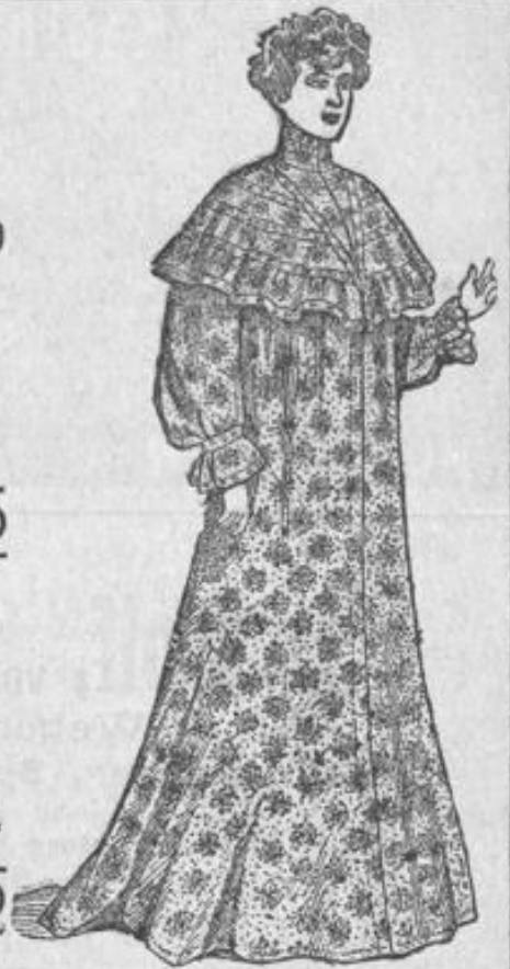
Morgenrock aus imit. Musselin in eleganter Ausführung Stück 10.90. Matinee Stück 7.90.