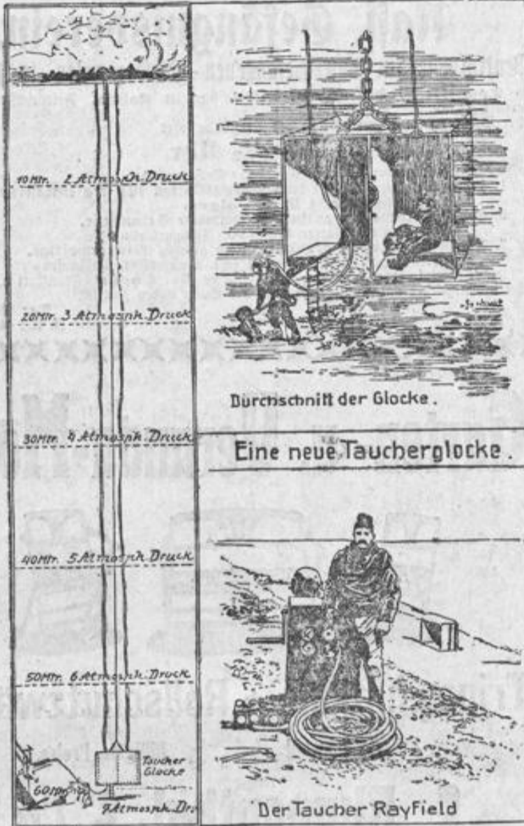
Durchschnitt der Glocke.