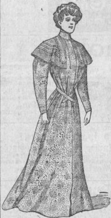
Morgenrock aus waschechtem Kattun in neuen Dessins Stück 6.90. Matinee Stück 4.75.

Durch den zentralisierten Einkauf für unsere 11 Kaufhäuser wird unsere Leistungsfähigkeit durch nichts überboten.