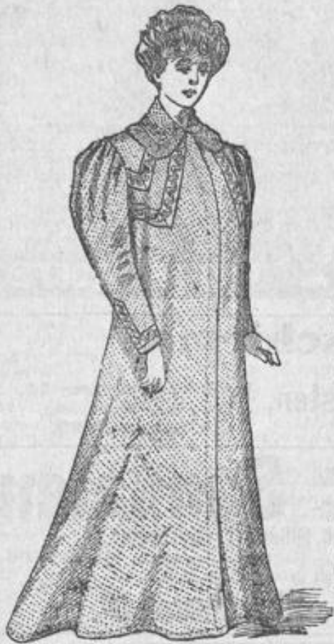
Morgenrock aus solidem Cretonne Stück 4.50. Matinee in derselben Ausführung St. 3.25.