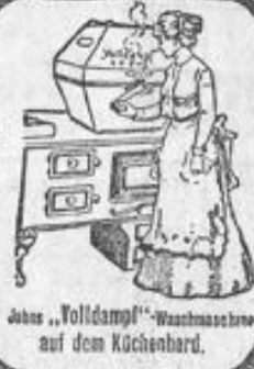
John's „Voll dampf“-Waschmaschine auf dem Küchenbord.