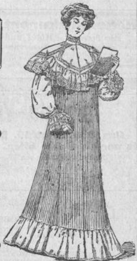
Morgenrock a. reinwoll. Voile u. Batist, plissiert, Stück 18.—. Matinee Stück 11.—.