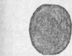
No. 6. Haarknoten aus einem verschlungenen Teil v. 4 Mk. an.