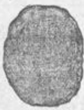
No. 9. Haarknoten aus einer Puffe und herumgelegtem Zopf von 10 Mk. an.