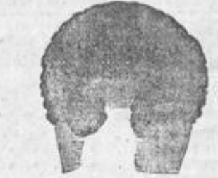
No. 4. Künstl. Vorderfrisur, sehr kleidsam und bequem, von 12 Mk. an.

No. 12. Löckchen an Draht aus krausem Haar zur Ergänzung und Schonung des Stirnhaars à Paar 3 Mk.