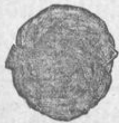
No. 8. Haarknoten aus extra langem Haar 20 Mk.