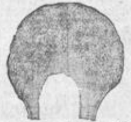
No. 3. Damen-Scheitel 20-30 Mk. je nach Grösse und Qual. der Haare.