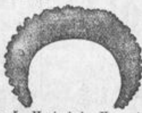
No. 5. Hygienische Haarunterlagen auf Hohlgestell gearbeitet, sehr leicht u. gesund, 2,75 Mk.