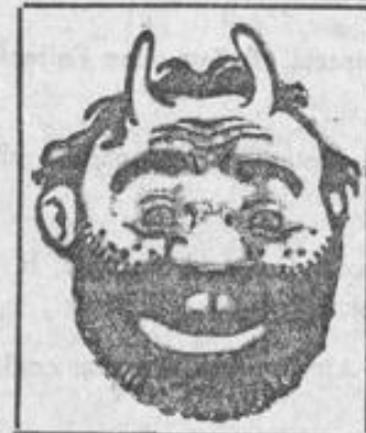
Filzig. — Geruchlos.