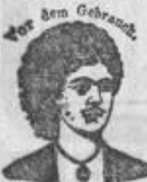
Vor dem Gebrauch