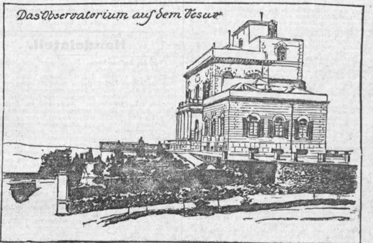
Das Observatorium auf dem Vesuv

zerstört und dem lieblichen Torre-Annunziata droht ebenfalls die Vernichtung durch Feuer. Der Optimismus des Leiters des Observatoriums ist fürchtbar widerlegt worden. Die Cooksche Vesuvbahn ist vollständig von Lavamassen überdeckt und zerstört. Die Feuersäulen erreichen Höhen von 150 Metern. Weißglühende Massen werden bis zu gewaltiger Höhe herausgeschleudert. Eine Anzahl neuer Krater haben sich gebildet. Besonders stark ist der Ausbruch des Hauptkraters. Die Ausbrüche sind von heftigen Getösen begleitet und verursachen Erschütterungen, die in der ganzen Umgebung des Vesuvs wahrgenommen werden.