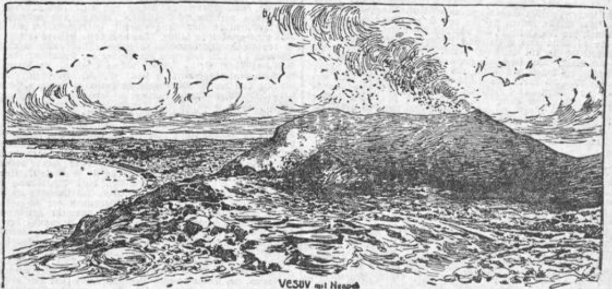
VESUV mit Neapel

brechen von Zeit zu Zeit in Schludgen und lautes Geheul aus. Der Erzbischof hat im Dom die Statue des heiligen Januarins ausstellen lassen, und ganz Neapel liegt vor ihr auf den Knien, um eine Abwendung der Katastrophe zu erwirken. Um eine Rettung der Stadt ganz sicher zu erwirken, haben sich im Dom auch die vor „Blauwunder“ her bekannten Klageweiber (genannt di-