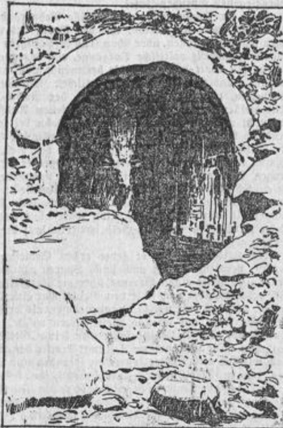
Neue ägyptische Ausgrabungen.

jedem ägyptischen Gotte hier in einem Riesentempel eine Andachtsstätte erbaute, Nachgrabungen veranstaltet und dabei ein Heiligtum der Göttin Hathos entdeckt, das ganz unverfälscht war, und dessen Buntmalereien noch so gut erhalten waren, als ob sie eben erst geschaffen seien.