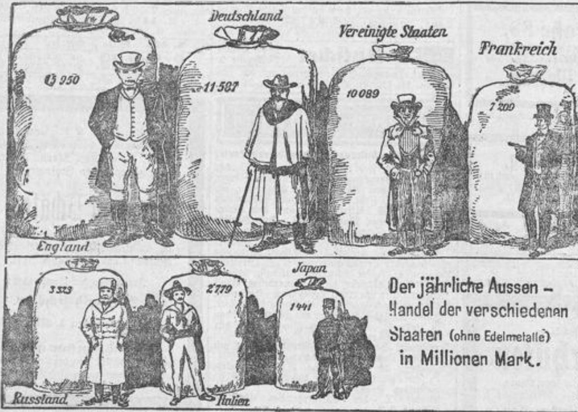
Der jährliche Aussen-Handel der verschiedenen Staaten (ohne Edelmetalle) in Millionen Mark.

Eins der kältesten Länder der Erde ist das ungeheure Gebiet von Alaska, das etwa 2 1/2 mal so groß wie Frankreich ist. Die Goldsucher, die seit einigen Jahren in Scharen in dieses Land geströmt sind, hatten namentlich anfangs, solange es noch an dem nötigen Schutz fehlte, furchtbare Leiden zu erdulden. Im Yukon-Tale hat man eine Temperatur von 77 Grad unter Null beobachtet. Wenn eine so starke Kälte auch nur äußerst selten vorkommt, so sind Temperaturen von 50 bis 60 Grad unter Null im Winter doch ziemlich häufig.