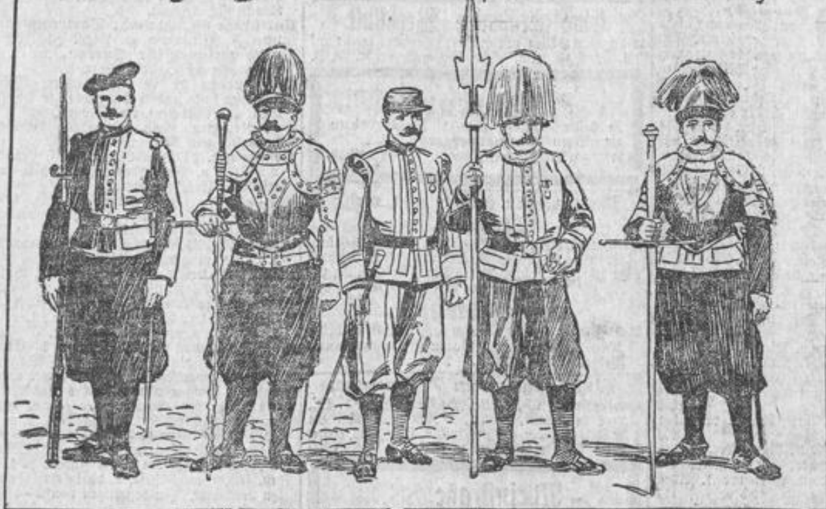
Zum 400jährigen Jubiläum der päpstlichen Schweizergarde.

staats, aber sein Hauptziel, Italien von der Fremdherrschaft frei zu machen und zu einigen, konnte er nicht erreichen. Ihm ist die Schaffung der Schweizer-Garde zu danken. In der damaligen Zeit stellten mit Vorliebe die Söhne der freien Schweiz fremden Nationen ihre Dienste gegen höchste Bezahlung zur Verfügung; wir erinnern nur an den Spruch: „Kein Kreuzer, kein Schweizer!“ und so wie Spanien und Holland, Frankreich und andere Mächte mit dem Blut schweizerischer Söldner ihren Bestand zu schützen suchten, so kam auch Papst Julius II. zu diesen Schweizer Gardisten, denen man eine besondere Treue und Zuverlässigkeit nach-