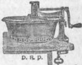
D. R. P.

fach bewährt und für jede praktische Hausfrau unentbehrlich sind die berühmten Küchenhelfer.