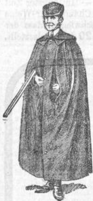
Höchste Auszeichnungen auf allen beschickten Ausstellungen.