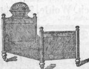
Schweres Holzbett, fein Nussbaum-lackirt,