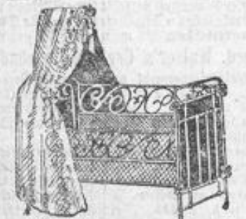
Eisen-Bettstellen und Kinder-Bettstellen

Dieselbe Bettstelle, Nussbaum-polirt, innen Eichen, kostet 38,50 Mk.