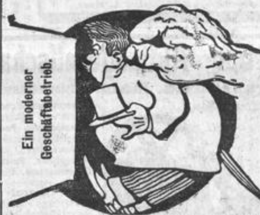
Ein moderner Geschäftsbetrieb.

Herrlich zum Diktat und Sprachenlernen ist die „Continental“-Schnellschreibmaschine, unerreicht, anstatt M. 400, jetzt nur M. 375, auch auf Ratenzahlung. Diesem berühmt, erstklass. Weltwunder gehört unbedingt die Zukunft! Farbbänder f. Ideal, Adler, Pittsburg, Franklin etc. zum Engrospreise. Leinen-Trikot-Copierblätter, neu, f. Maschinenschrift, Hektografen. Ersatzrollen für Vervielfältigungs-Apparate. Billigste Bezugsquelle f. Kohlstoffpapiere, Farben, Goldfüllfedern, KLIO-Schreibfedern, Heftmasch., Copiermasch. und alle Büro-Einrichtung, Registratoren, ab Fabrik. Stritter's Büro, Röderallee 14. Gelegenheitskäufe aller Systeme. — Unterricht, Miete, Reparatur, Tausch, Hunderte von Referenzen. Waschmasch., Rechenmasch., Ladenkassen, concurrenzlose Neuheiten. — Hofliefer. d. reinsten Ind. Lothentz-Thee's à M. 250. 1660