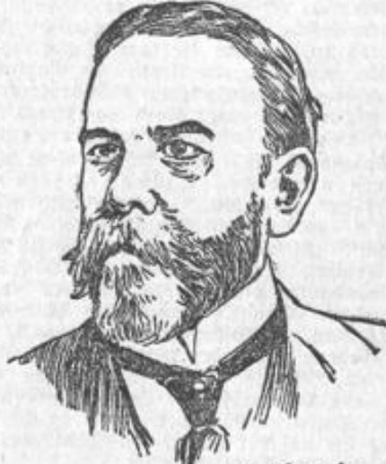
Staatssekretär Hay †