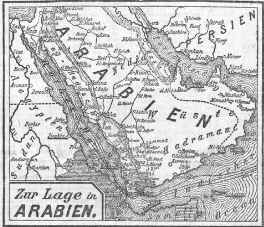
Zur Lage in ARABIEN.

Der „kranke Mann“ macht jetzt ungewöhnliche Anstrengungen, den gefährdeten arabischen Besitz zu behaupten, und nachdem die türkischen Besatzungen auf