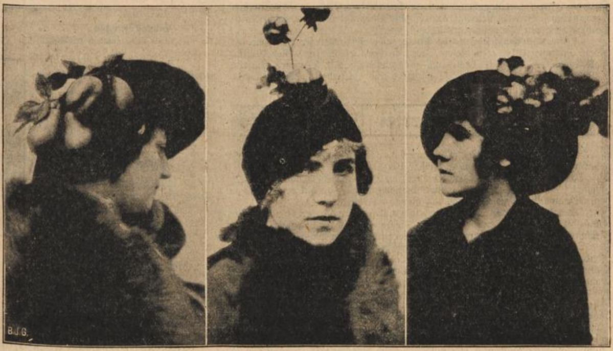
Die letzte Pariser Hutmode für den Sommer 1914. (Mit Text.)

Als ich das Bewußtsein wieder erlangte, bemerkte ich mich im Krankenhaus, wo ich mich nach rasch erholte, so daß nach wenigen Stunden bereits meine Vernehmung seitens des Richters stattfand. Was konnte ich angeben? Während die Ruhepause verließ, war eben Feuer ausgebrochen, so daß ich nicht zugrunde gegangen wäre, hätte mich nicht die Feuerwehr noch rechtzeitig herausgeholt.