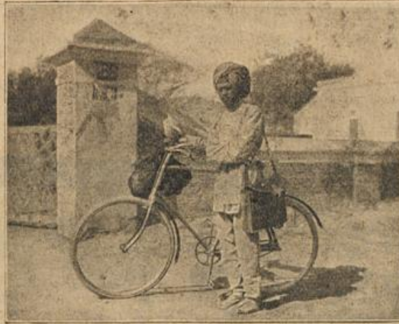
Ein indischer Briefträger. (Mit Text.)

Erstaunt sah er sie an, aber als er ihr glühendes Gesicht sah, lächelte er wieder so spöttelnd überlegen, und versuchte, sie von neuem an sich zu ziehen.