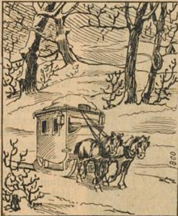
Wo ist der Richter?