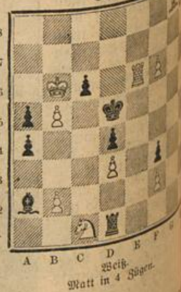
Mat in 4 Zügen.