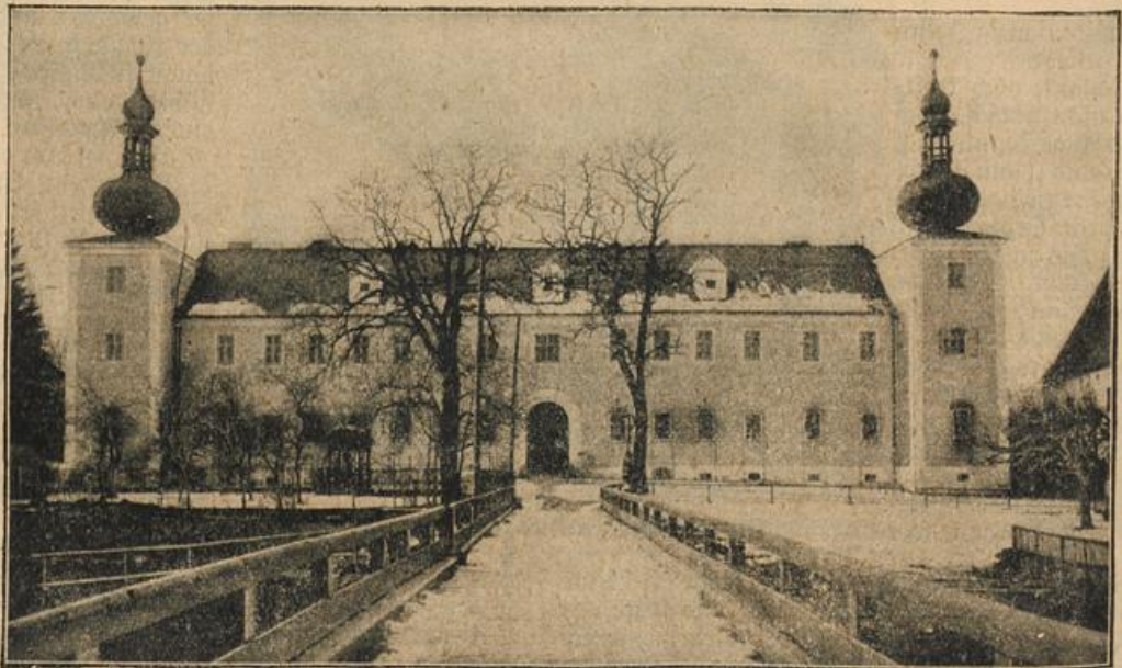
Das Schloß Johann Orths bei Gmunden als Erholungsheim für Förstler. (Mit Text.)

Selmann hielt die Hand an die Stirne, als müsse er sich denken. „Kurt Wellano,“ wiederholte er halblaut, in welcher ruft mich dieser Name! Er ist mir bekannt, ja in lieber Erinnerung ein Schulfreund, ha natürlich, der gute Wellano, wohl viele Jahre liegen zurück, seit wir mit einander die Schulbank geteilt O damals!“ Wieder seufzte er tief. „Laß ihn eintreten, und mache Licht“, befahl er, innerlich in freudiger Erwartung endlich einen Menschen ins Haus zu bekommen, mit dem er sich ach so viel reden konnte.