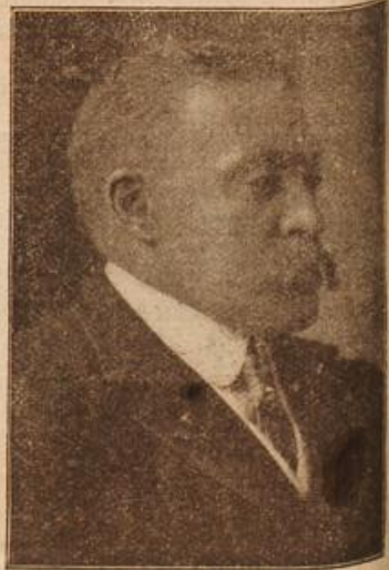
Jzwolski, der russische Gesandte in Paris. (Mit Text.)