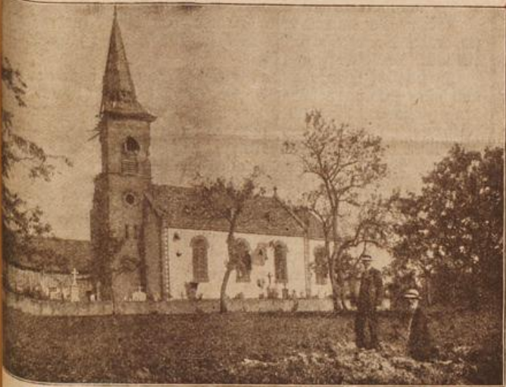
Die Kirche im Dorf Schmedensbusch bei Saarburg. (Mit Text.)

den Worten, die mich einen Blick in ein stürmisches Mannesherz tun lassen. „Man wird die Aufhebung der amtlichen Erklärung, die offenbar seitens der hiesigen Behörden auf