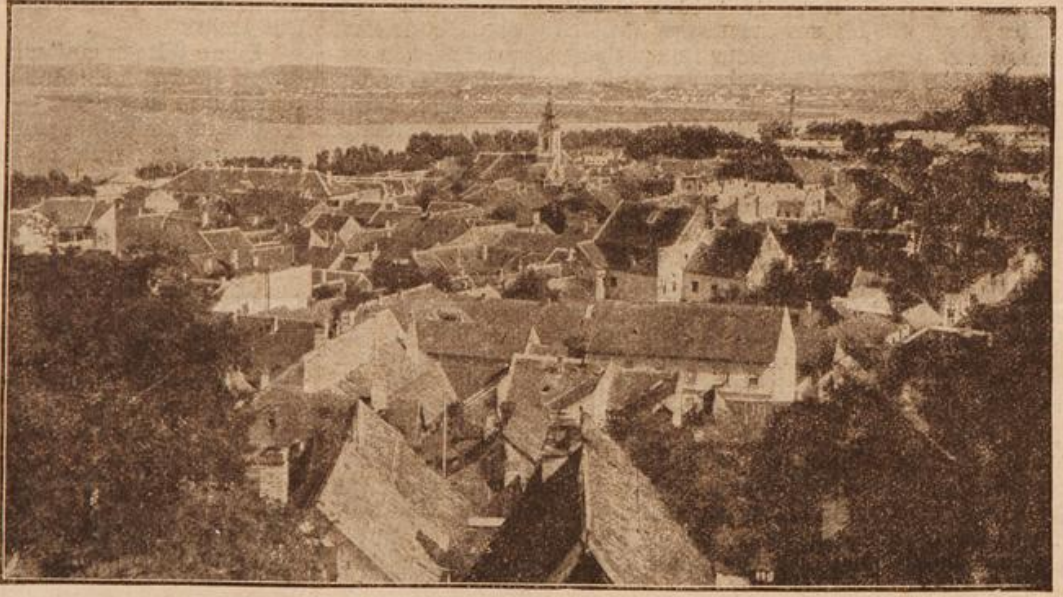
Ansicht von Semlin. (Mit Text.)

Ich kam nach Versailles, sah den neuen Kaiser und seine Palastne, erneuerte im Hotel des Reservoirs, dem großen Treffpunkt der höheren deutschen Offiziere, alte Bekanntschaften und knüpfte neue an und reiste endlich nach Le Mans weiter, wo mir ein Neffe an einer Verwundung darniederlag. Ich traf ihn schon wieder bei gutem Wohlbefinden und konnte seiner