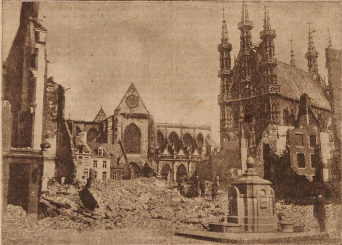
Das berühmte Rathaus und die Kathedrale von Löwen. (Mit Text.)

Als man endlich wieder die Oberförsterei erreicht und Lottchen