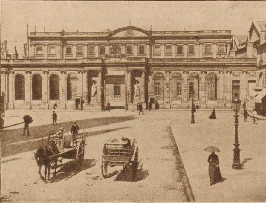
Verlegung der franz. Regierung nach Bordeaux: Sitz des Ministerpräsidenten Viviani.

Schneekoppe bis zum Reifträger, sah alle die kühlen, grünen Gründe und Täler, hörte die Quellen murmeln und die Wälder rauschen, und kam nicht los aus dem Bann und dem Zauber der Heimat. Und wen, der in der Fremde — im „Clend“, wie unsere Vorfahren so bezeichnend sagten — weilen muß, dieser Zauber erst einmal hat, den läßt er nimmer los.