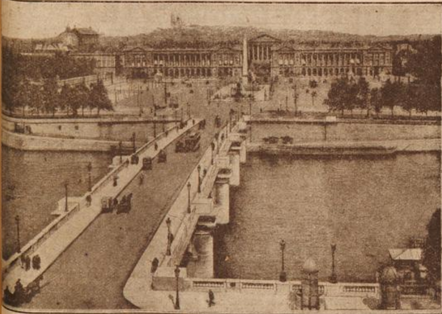
Aus Paris: Die Place de la Concorde mit dem Obelisk von Luxor. (Mit Text.)

den Worten, die mich einen Blick in ein stürmisches Mannesherz tun lassen. „Man wird die Aufhebung der amtlichen Erklärung, die offenbar seitens der hiesigen Behörden auf