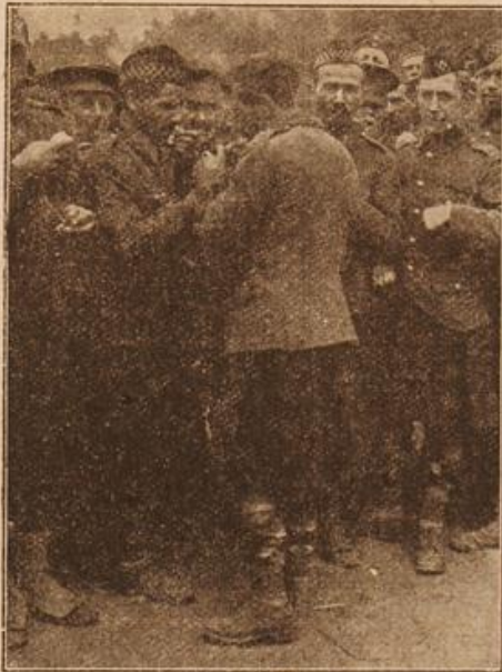
Englische Gefangene in Döberitz.

Schneekoppe bis zum Reifträger, sah alle die kühlen, grünen Gründe und Täler, hörte die Quellen murmeln und die Wälder rauschen, und kam nicht los aus dem Bann und dem Zauber der Heimat. Und wen, der in der Fremde — im „Clend“, wie unsere Vorfahren so bezeichnend sagten — weilen muß, dieser Zauber erst einmal hat, den läßt er nimmer los.