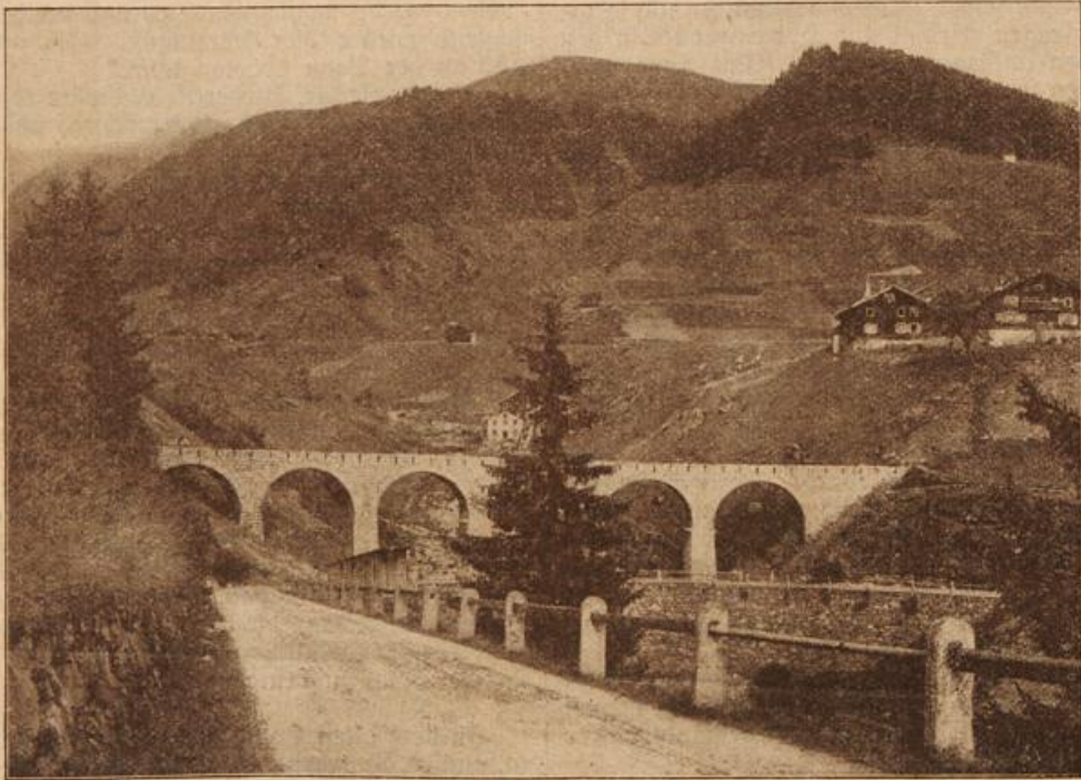
Die Furtabahn: Val Segnes und Cuoz. (Mit Text.)

Hortense blickte auf das goldene Kreuz, das von der Sonne beschienen gen Himmel ragte. Auch ihre Lieben waren alle dahin, nur sie war noch zurückgeblieben. Jetzt in ihrem großen Glück sterben zu können, es müßte schön sein. Ja, so denken Verliebte, dachte sie und langsam ritten sie wieder dem Schloß zu. Noch mußte der Fürst nicht, wie bald er wieder an diesem