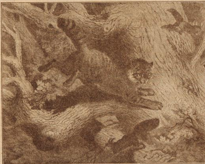
Wildkatze auf der Eichhornjagd. Zeichnung von J. Specht. (Mit Text.)