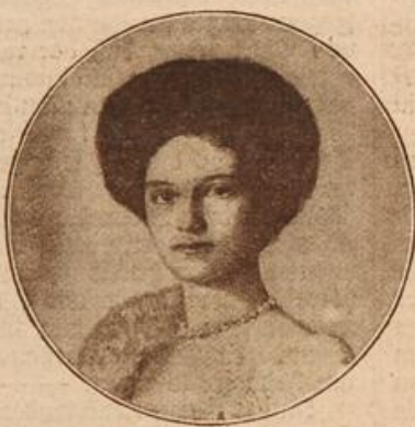
Der neue österreichisch-ungarische Thronfolger Erzherzog Karl Franz Joseph mit Gemahlin Sisi. (Mit Text.)