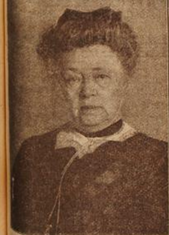
Baronin Verta von Suttner f. (Mit Text.)

John Castel, der zweite Verwalter des Schafbarons, kam jetzt hinzugeritten und sagte: „Sie können ohne Sorge sein, Master, und getrost abreiten, ich werde alles gut versorgen und die Augen offen halten.“