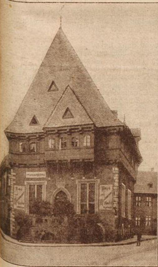
Das historische Gildehaus in Goslar. (Mit Text.)

Mühe, die er für einen Augenblick auf einen Stuhl gelegt hatte, stülpte sie auf und steuerte mit festem Schrittdirekt auf den kleinen Gattich zu. Aber noch bevor er dort war, hatte Else ihren Leutnant beim Arme ergriffen und tanzte mit ihm dahin. Eine grim- mige Wut erfaßte ihn, besonders aber weil er glaubte, auf ihrem Gesicht ein trium- phierendes Lächeln ge- sehen zu ha- ben. Er war viel zu viel Weltmann, als daß ihn sein Mißer- folg hätte