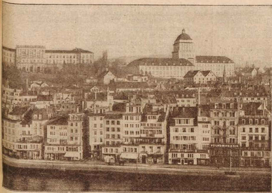
Die neue Universität in Zürich. (Mit Text.)

„So, das freut mich!“ erwiderte er einfach.