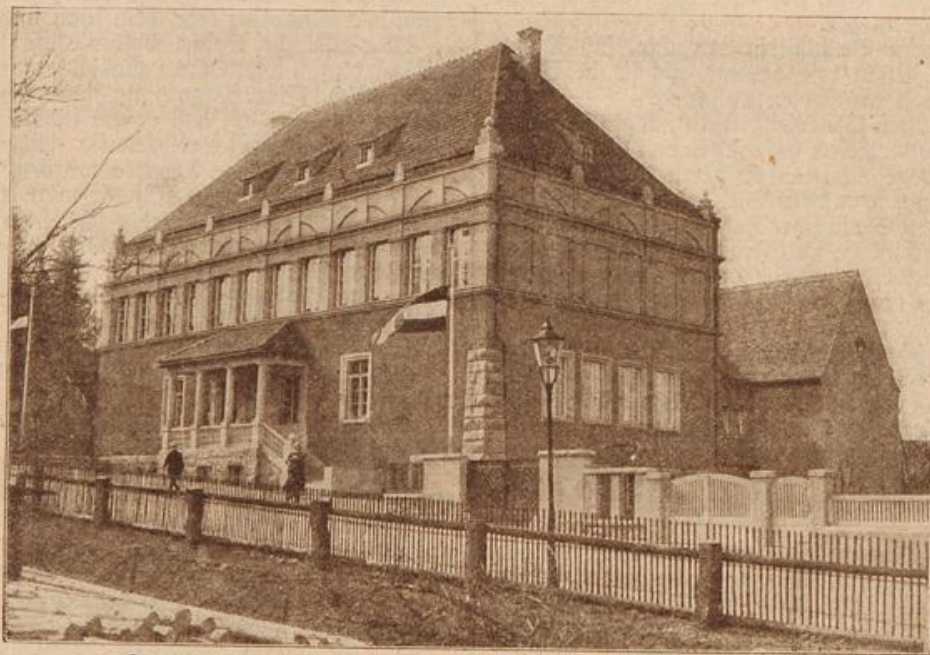
Das neue Riesengebirgsmuseum in Hirschberg i. Schl. (Mit Text.)

Bei ihrem Eintritt erhob sich Herbert aus dem Sessel und ging ihr einige Schritte entgegen. Sie bemerkte sofort, daß eine Veränderung mit ihm vorgegangen war. Er sah bleich und finstern aus, und die Wolke auf seiner Stirn sagte ihr ohne Worte, daß sein Erscheinen keine neue Hoffnung für sie bedeutete.