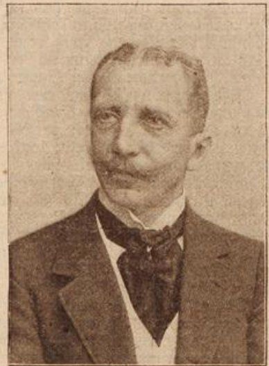
Wirtl. Geh. Rat Jr. Wilh. v. Loebell, der neuernannte preuß. Minister des Innern. (Mit Text.)

Die schwarze Else war vor Schreck fast gläubt und ließ ihre Hand, die die Tasse hielt, kraftlos in den Schoß fallen; sie war über- haupt unfähig, etwas zu tun oder zu sagen. Ihr Ritter, schon empört über das dreiste Benehmen dieses „Burschen“, überschaute nun die Sachlage. Sporenklirrend sprang er auf, stampfte mit dem Säbel auf den Boden, konnte aber vor Erregung kein Wort hervor- bringen und rang, kirschrot im Ge- sichte, nach Atem.