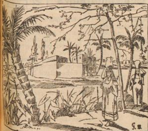
Was ist der Vantee.

Der Gartenfreund einschreiten mußte. Es sind dies die Nachtschnecke, der Engerling und der Erdbeerrüssler. Die Nachtschnecke hat ihren Namen daher, daß sie im Gegensatz zu ihren Verwandten, den Weinbergschnecken, Schnirkelschnecken usw., kein Haus trägt. Von unseren Gartengewächsen bevorzugt die Nachtschnecke hauptsächlich die köstliche Erdbeere und den zarten Salat. Die schönsten Beeren werden von ihr angefrisst, bis zuletzt nur noch der Stummel übrig bleibt. Die Schnecke geht ihren Lausfreuden nur in der Nacht nach, und einmal um Mitternacht überraschte der Gartenfreund bei Laternenlicht unzählige kleine Schnecken beim göttergleichen Mahle. Er sammelte die kleinen Schlemmer in einem Topfe und tötete sie durch Überbrühen mit heißem Wasser. Auch legte er kleine Brettchen zwischen den Erdbeeren nieder; die Schnecken vertriehen sich tagsüber darunter und können leicht eingesammelt werden.