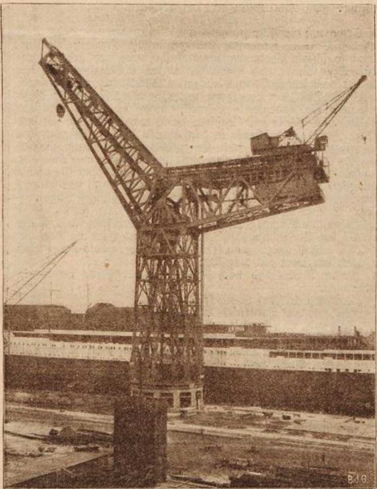
Ein technisches Riesenwerk. (Mit Text.)

Weiter kam er nicht, denn der scheinbar ruhige Student hatte