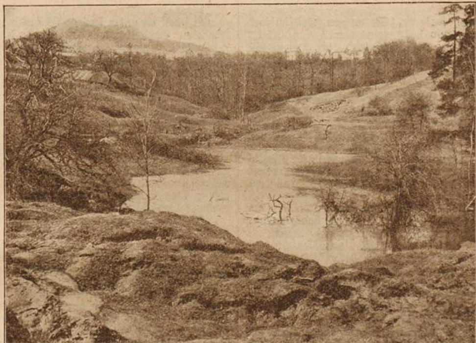
Der wandernde Berg in Böhmen. (Mit Text.)

pierten sich um die drei Tische in der oberen linken Ecke, wo man den ganzen Saal vollständig überschauen konnte. Recht war der Kaffee nicht ganz alle, als die Musik mit einem feurigen Straußwalzer einsetzte. Auf einen Schlag sprangen die Franken auf, und bald wogten die Grünen zwischen weißen und hellfarbigen Sommertoiletten, schwarzen Fräcken und bunten Offiziersuniformen einher. Ganz interesselos blickte der weiland erste Chargierte der Frankonia in das Gewoge hinein. Er war als einziger Franke sitzen geblieben, und der sonst so leidenschaftliche Tänzer begnügte sich damit, seinen Glimmstengel zwischen