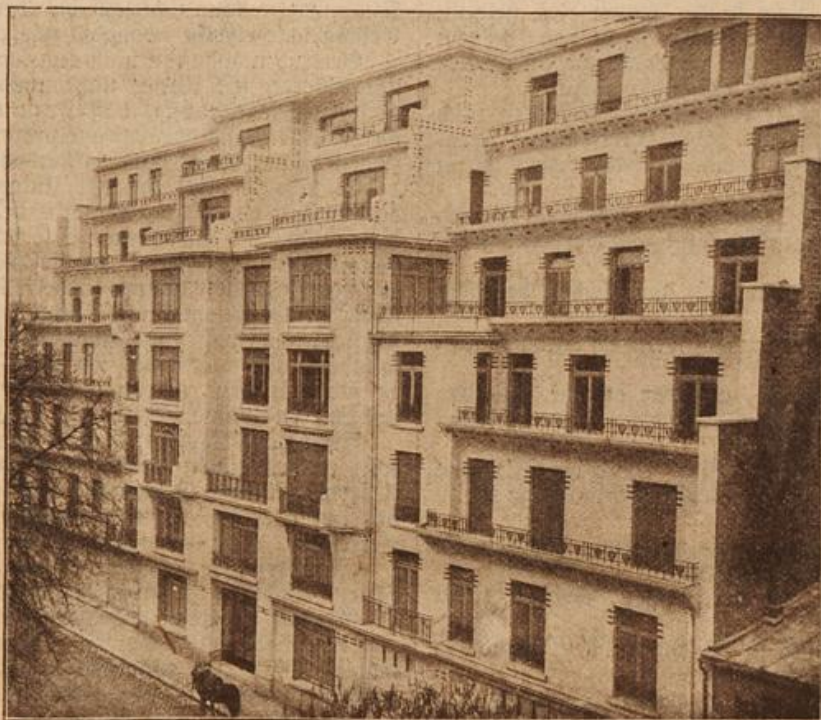
Eine neue Art von Wohnhäusern in Paris. (Mit Text.)

Gertrud sprang erschrocken von ihrem Sitz auf, denn die Blätter der Rosen und Kamelien stoben nur so um sie herum. Im nächsten Augenblick bemerkte sie, daß der junge Mann ihr