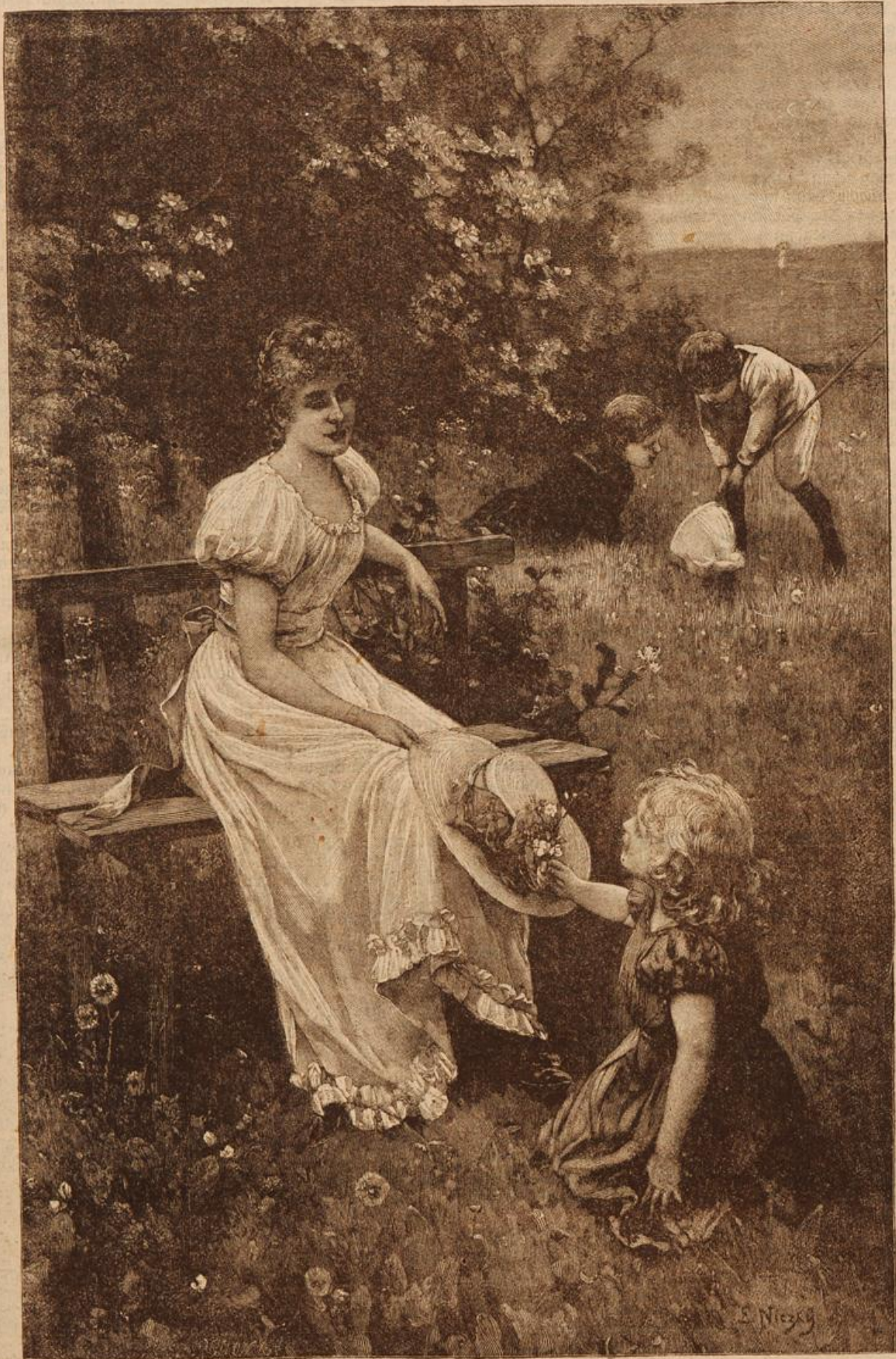
Im Frühling. Von E. Nitzky. (Mit Text.)