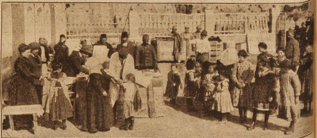
Die erste öffentliche Impfung in Albanien. (Mit Text.)

„Sie sind sehr kurz mit Ihrem Urteil, mein gnädiges Fräulein“, sagte Hubert Reding, der Jura studieren und ein großer Verwaltungsbeamter werden wollte, weil er behauptete, daß das Klappern der Mühle und der Mehlstaub ihm Nerven und Lungen schädigen würde.