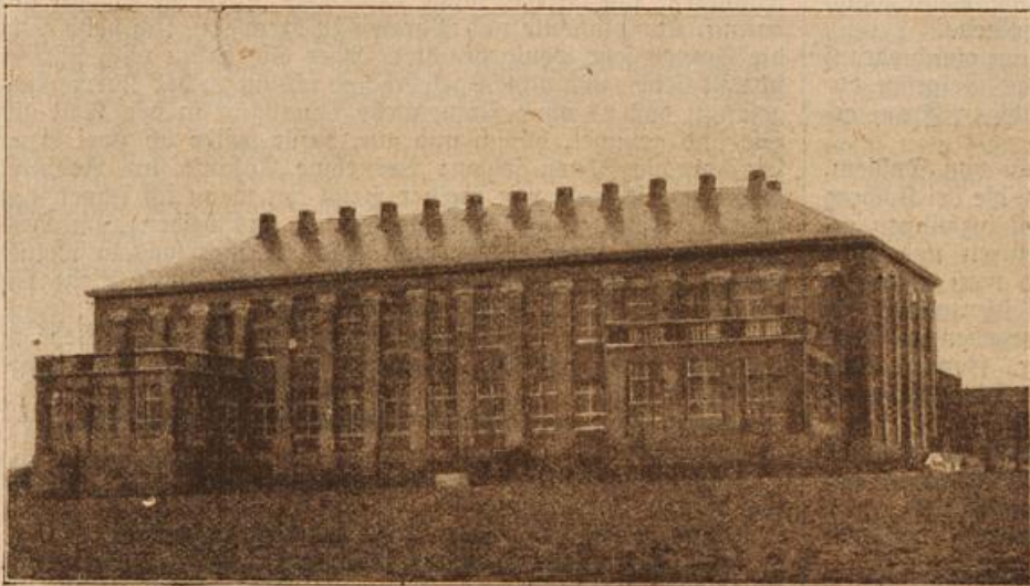
Das Kaiser-Wilhelm-Institut für Kohlenforschung in Mülheim a. d. R. (Mit Text.)

duftenden Holunderdolden. Lange Gewinde von Blumen und