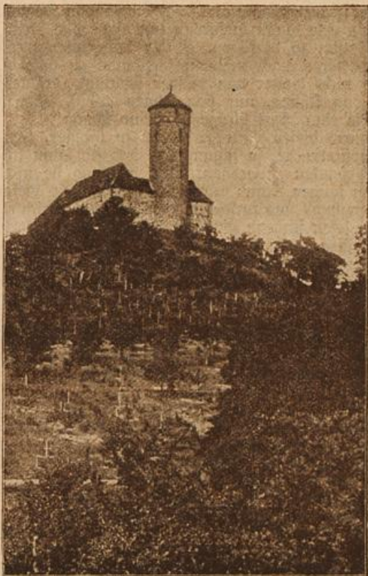
Burg Ludwigsstein im Werratal. (Mit Text.)

duftenden Holunderdolden. Lange Gewinde von Blumen und