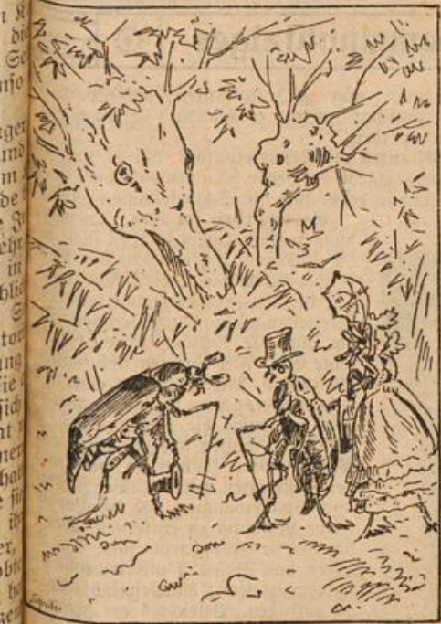
„Achtung ihr Malleser, die Ente kommt!“

Und Irene antwortete: „Ja, sie ist unvergleichlich“, denn sie dachte, daß der arme, verkannte Künstler, der sich mühselig vom Schlegelgejellen zum Orgelbauer durchgerungen hatte, in dieses Welt seine Seele gelegt hatte, seine Liebe zur Kunst und seinen Ehrgeiz auf die Kunst.