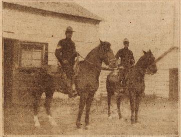
Kanadische berittene Polizei. (Mit Text.)

wählt hatten, eingenommen hatte, bemächtigte sich der Anwesenden großes Zagen und Bangen, denn sie fürchteten, daß ihr Landesherr seine Rechte überschreiten würde. Ärgerlich blickte der Erzbischof um sich, aber niemand hatte sich von seinem Platze gerührt.