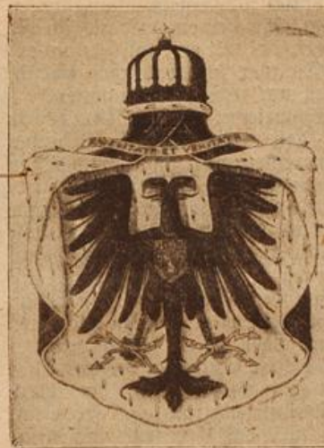
Neues Staatswappen Albanens. (Mit Text.)

„Ich bitte Platz zu nehmen. Die Versammlung ist eröffnet.“