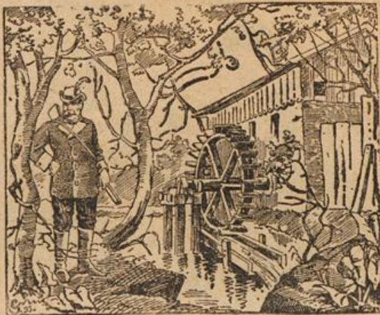
Wo ist die Mälderstöchter?

Eine afrikanische Maiskammer. Der Mais lagert, um gegen Termiten gesichert zu sein, unter dem Dache. Im Innern der Hütte ist ein Fetisch aufgestellt, der den Mais vor Dieben bewahren soll.