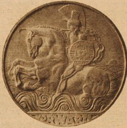
Erinnerungsmedaille an die österreichische Adria-Ausstellung. (Mit Text.)

Begeistert brachen die Edlen dann in den Ruf aus: „Ja, so sei es! Winneburg ist der richtige Platz.“