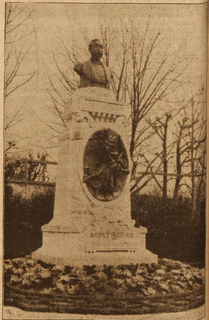
Denkmal für die Flugkatastrophe in Argentinien. (Mit Text.)

Der Kaiser hatte hierzu gelächelt, denn es war ihm ja bekannt, daß der Kurfürst von Trier als Knauser galt. Dem war es lieb, wenn seine Gäste den Wein eines schlechten Jahrganges tranken.