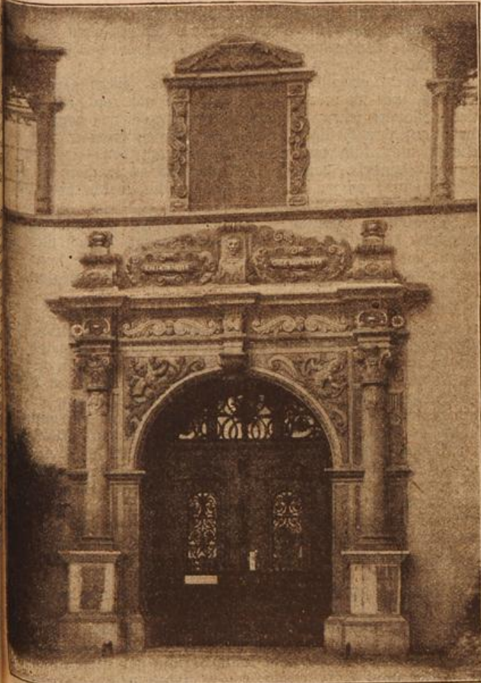
Das Portal am Rathaus zu Schaffhausen. (Mit Text.)