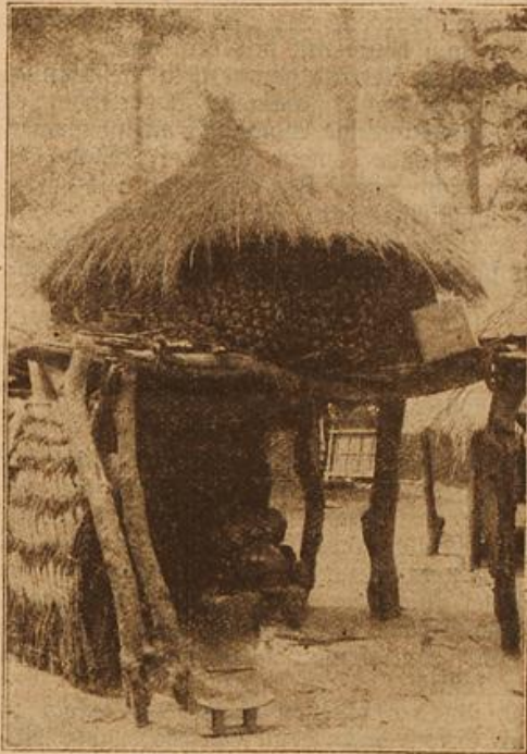
Eine afrikanische Maischeune. (Mit Text.)

Endlich blieb der Erzbischof stehen und wandte sich an die Versammelten. „Meine Herren,“ begann er, „wir haben schon länger gewartet, als eine zu weitgehende Höflichkeit es verlangt. Wie sehr Graf Winneburg unsere Beratungen achtet und schätzt, zeigt ja seine unentschuldbare Vernachlässigung des Amtes, das Ihr ihm übertragen habt und das er mit Freuden angenommen hat. Ich werde jetzt daher seine Stelle vertreten und ich bitte euch, Ihr Herren, zur Beratung Platz zu nehmen.“