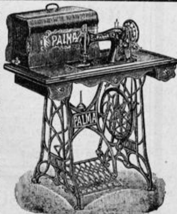
Weltausstellung Paris 1900 gold. Medaille. Höchste Auszeichnung. f. deutsch. Nähm.

An unsere verehrl. Leser richten wir die Bitte, unsere Zeitung in Freundes- und Bekanntenkreisen gefl. zu empfehlen. Wir senden gern an uns aufgegebene Adressen Probe-Exemplare gratis und franko.